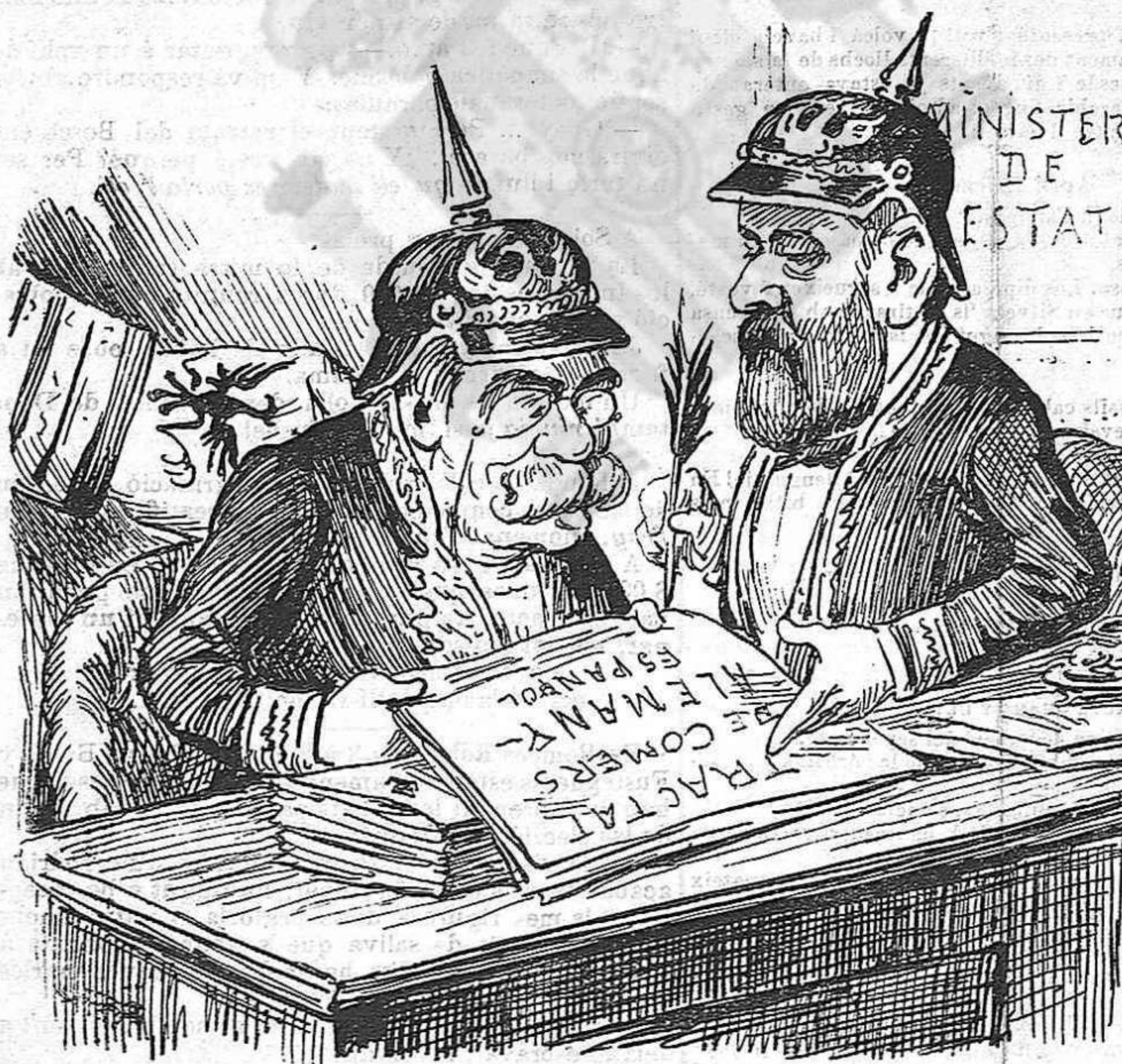
Segons dinhen de Madrid los homes que avuy ens manan ja han posat fil á la agulla pel tractat ab Alemania.