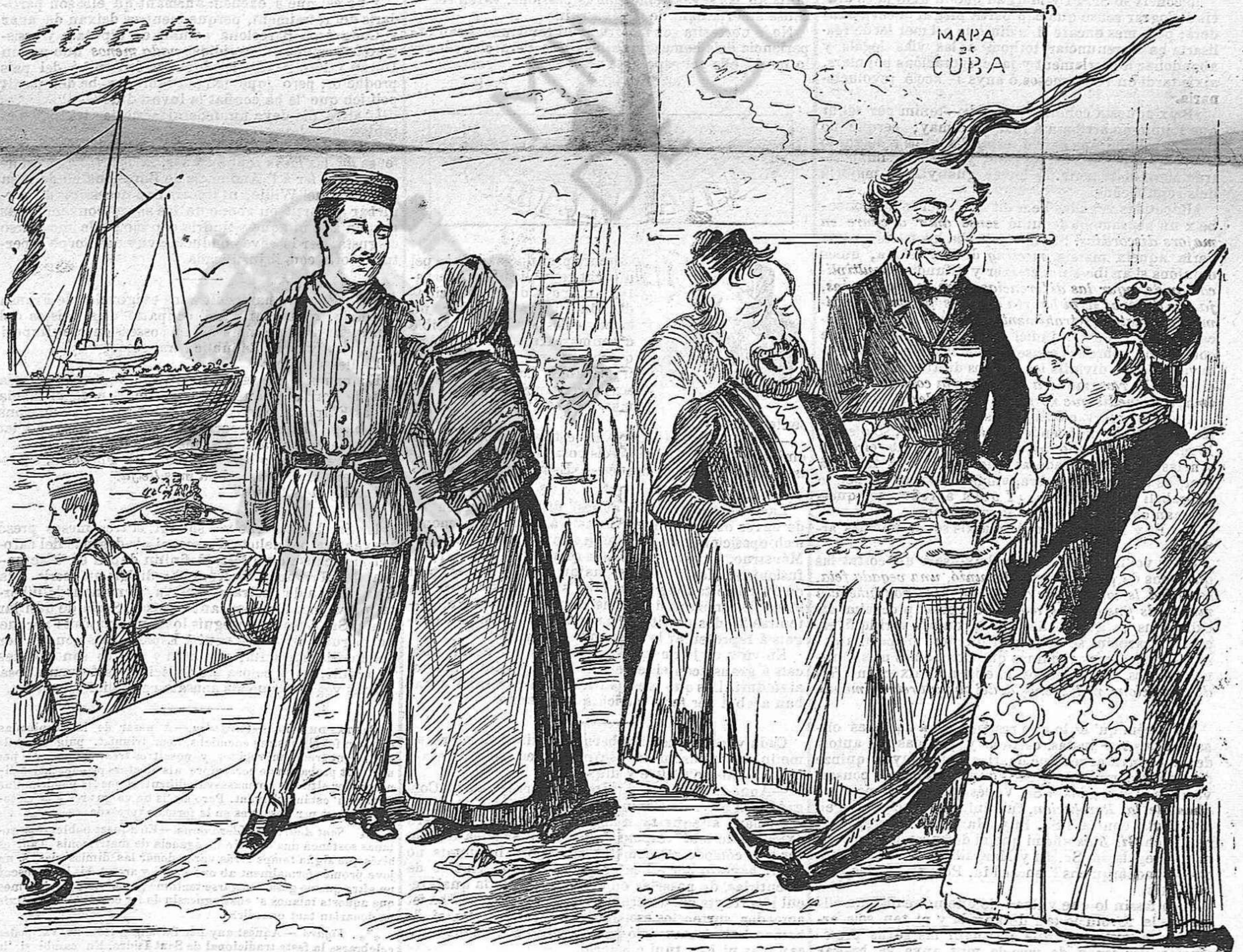
—Adeu, fill meu, torna aviat y ab gloria.