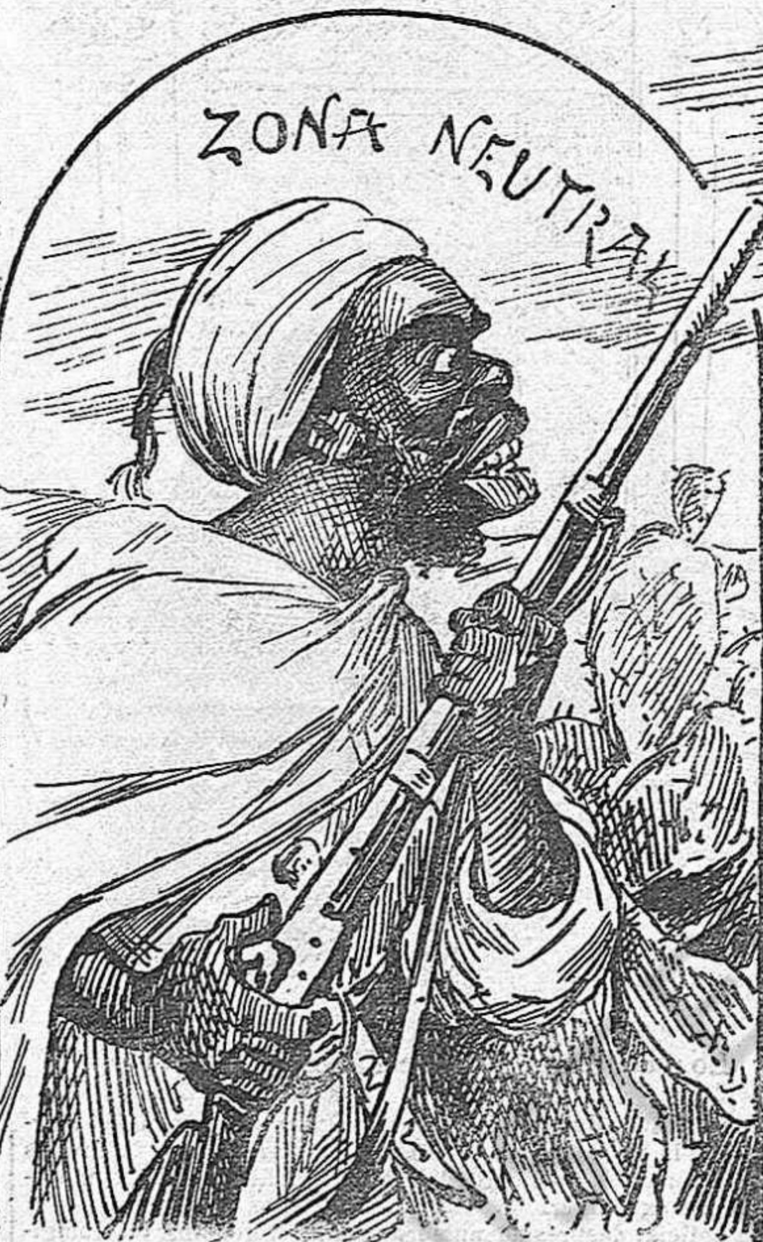
Preparats per arreglar la zona neutral