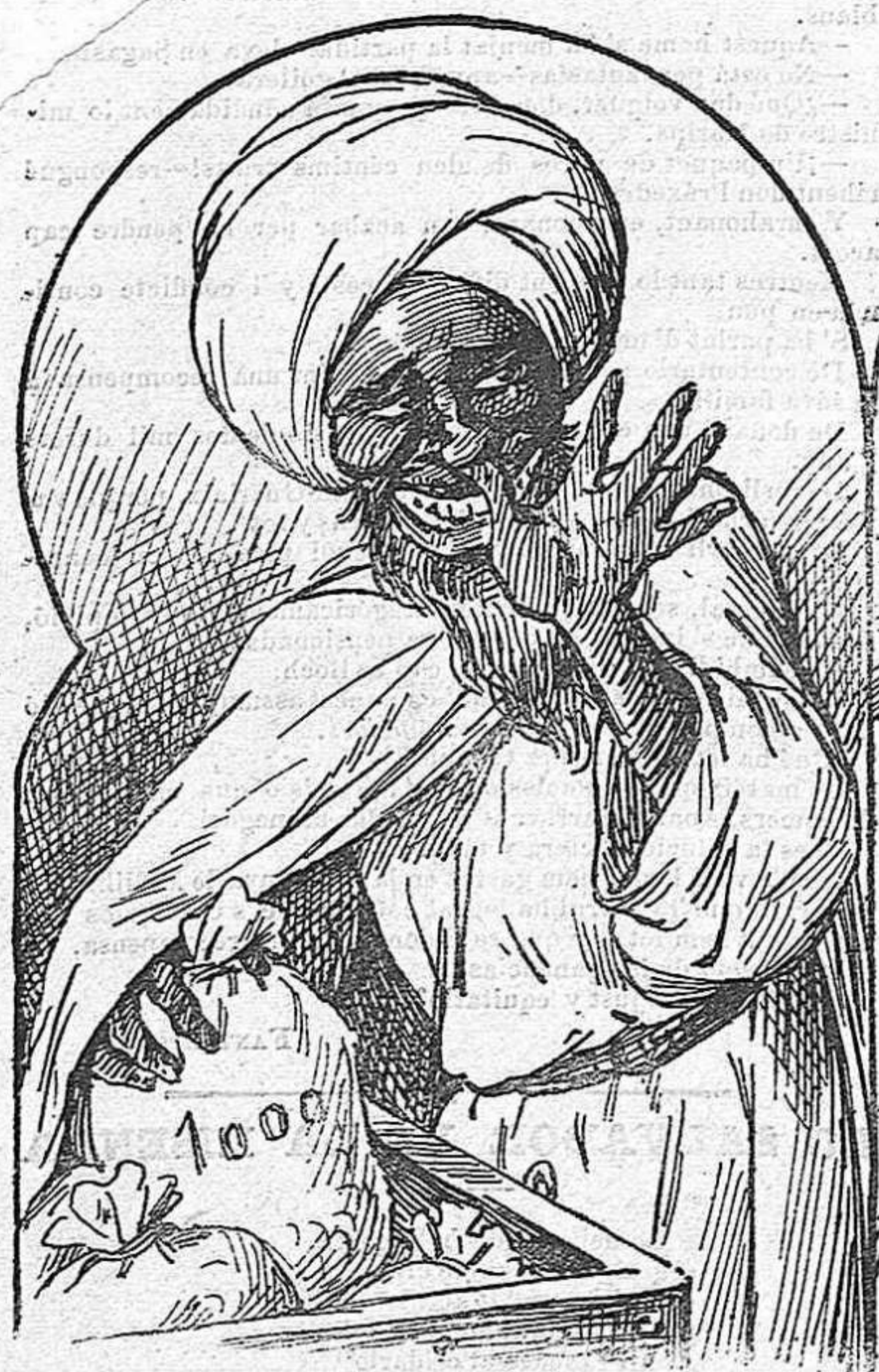
Disposats a pagar