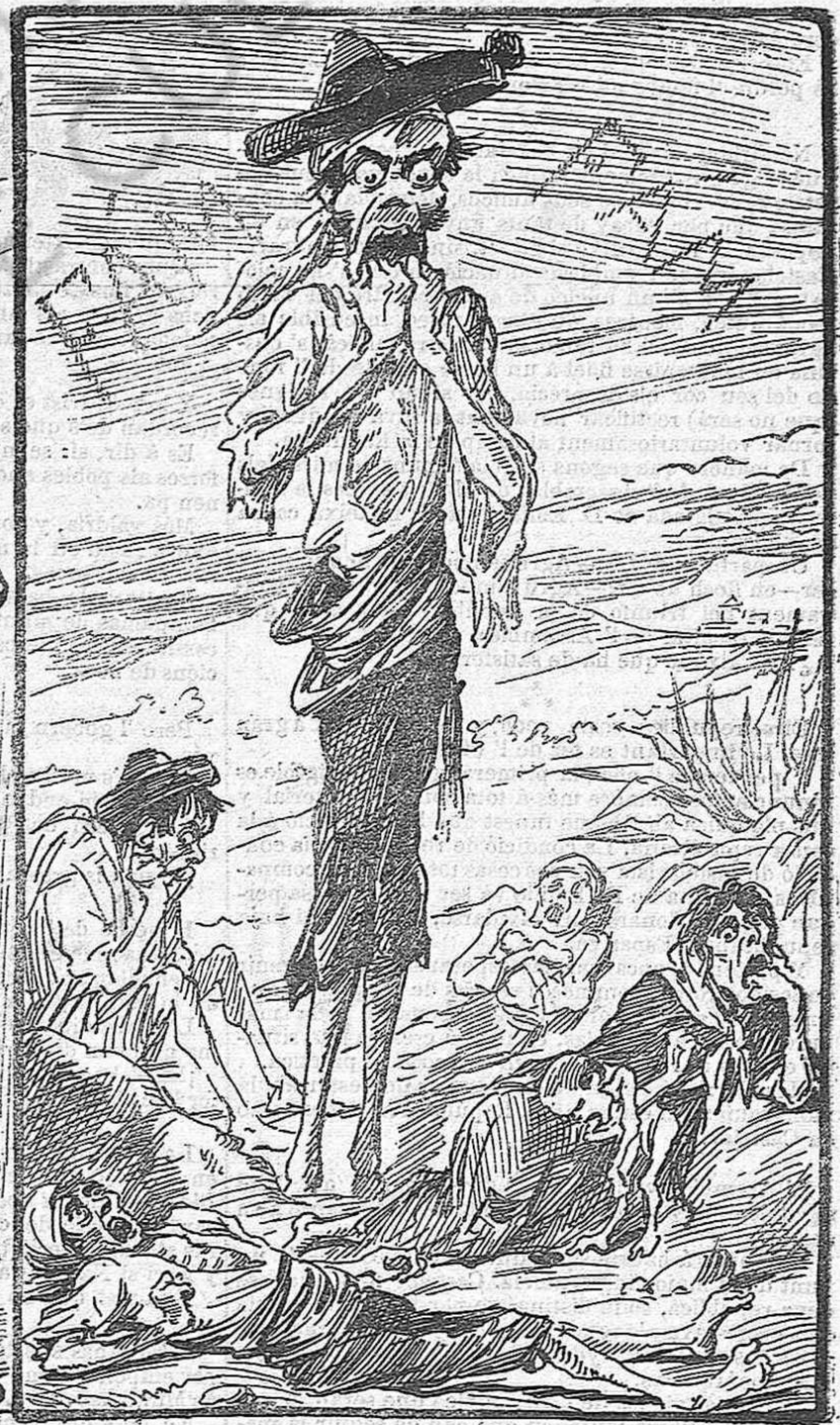
Mientras lo nostre Salvador se disposa à jugar la gran partida ab dos camaradas y à costa del país;