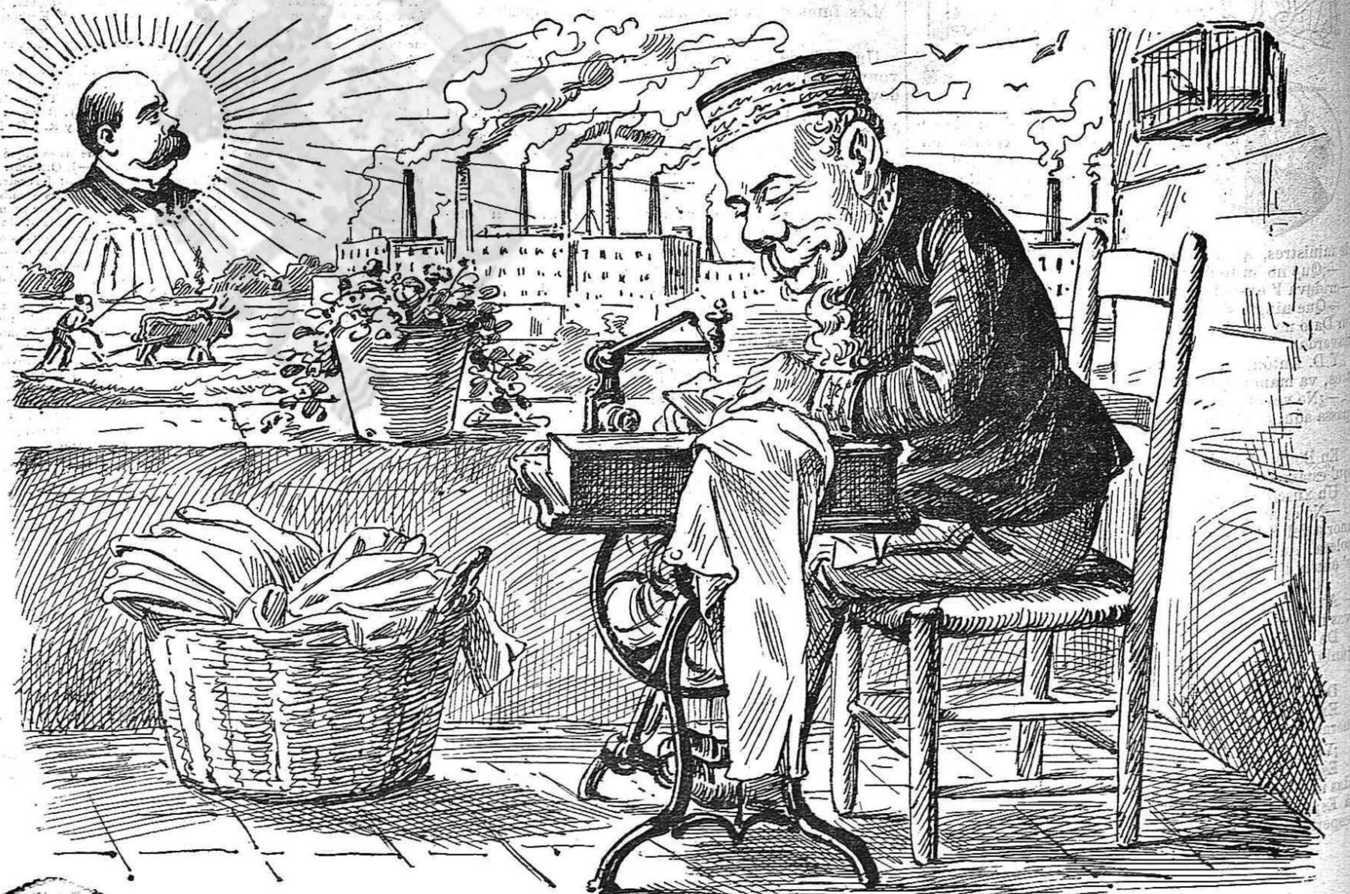
L' aspiració dels que pagan