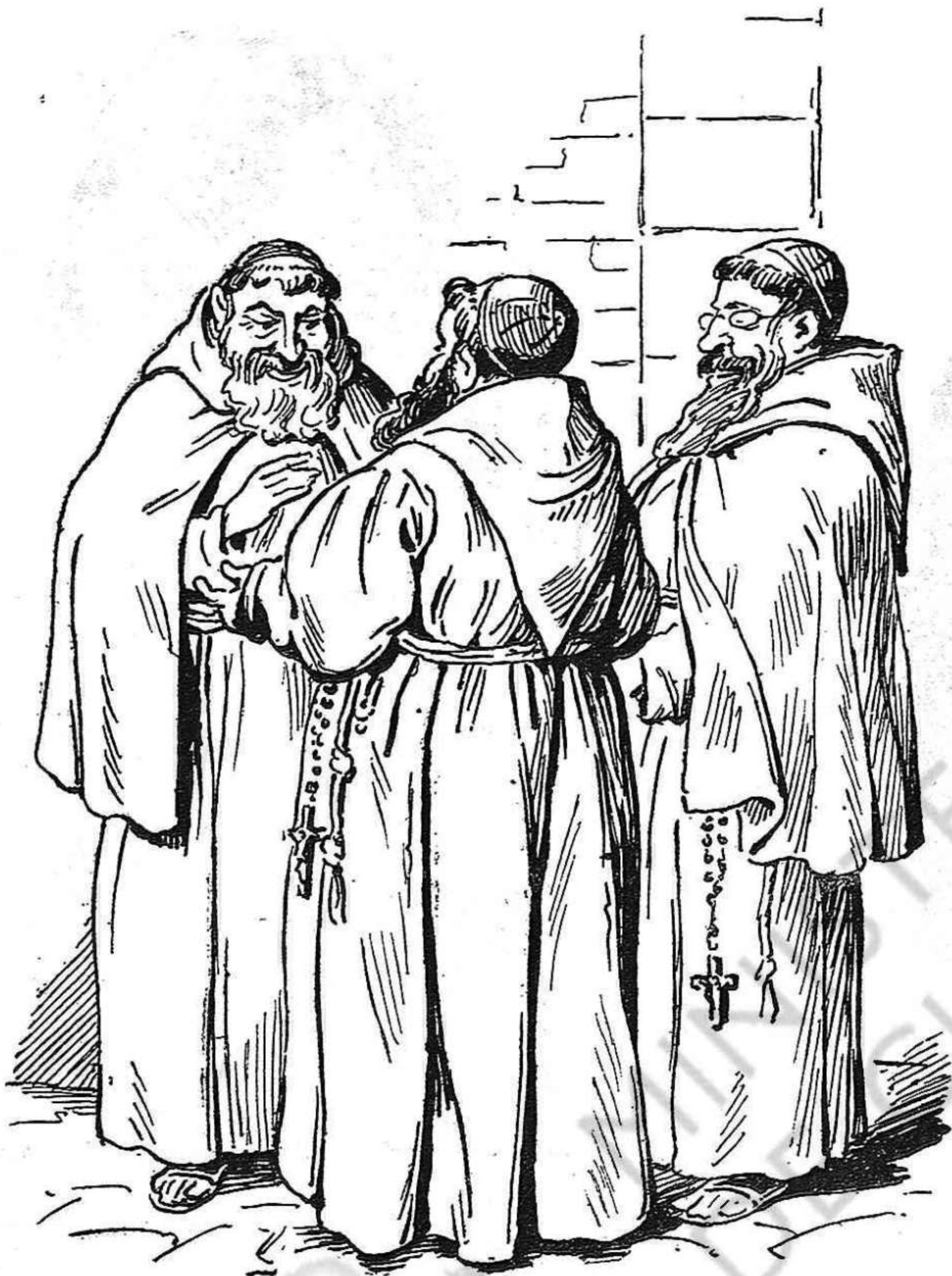
Per ells es huelga tot l' any; pero cobran.

los nanos son criatures y la seva poca edat justifica la indulgencia.