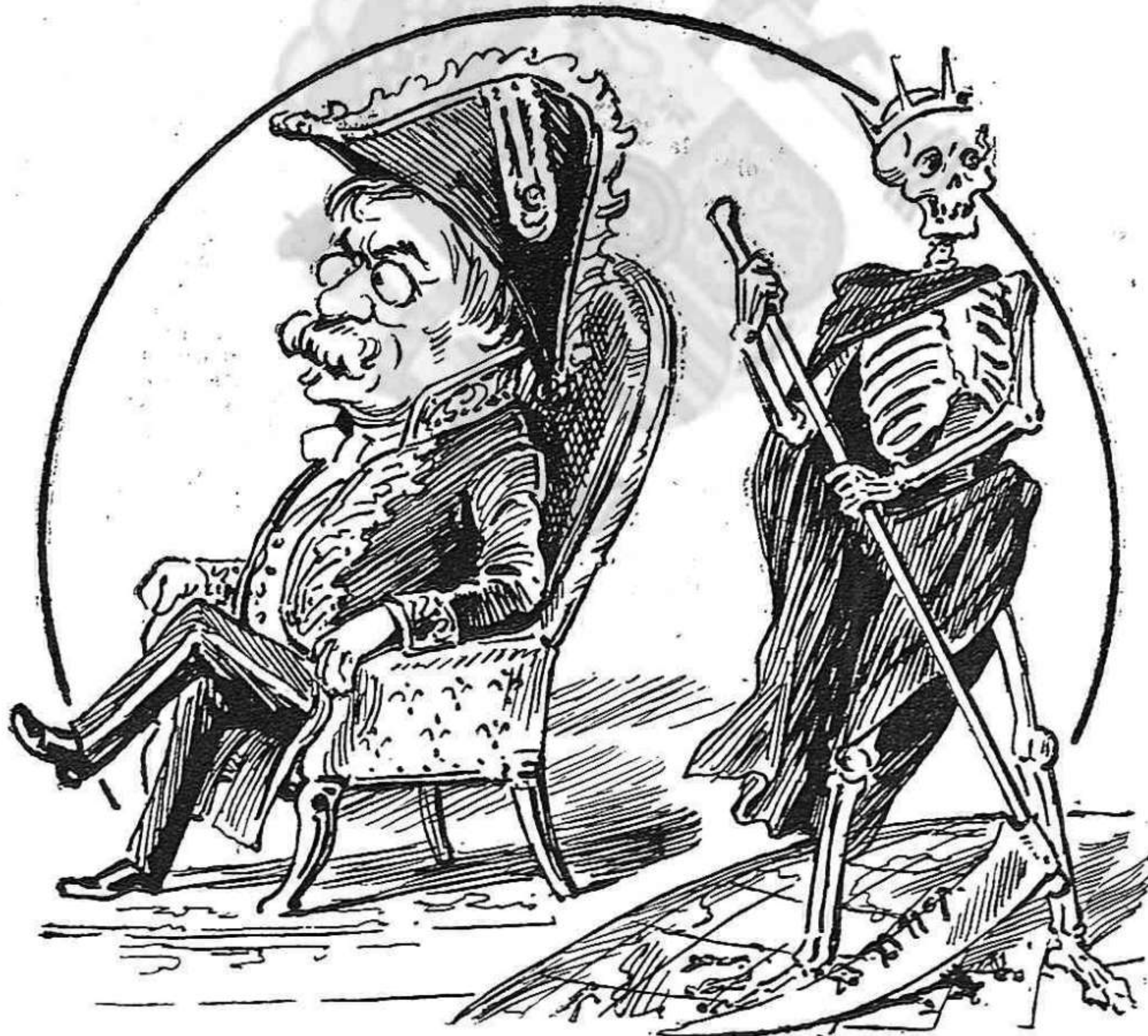
Per acabá ab lo país los dos se prestan ajuda: la huelga de aquest parell i que 'n fora de ben rebuda!