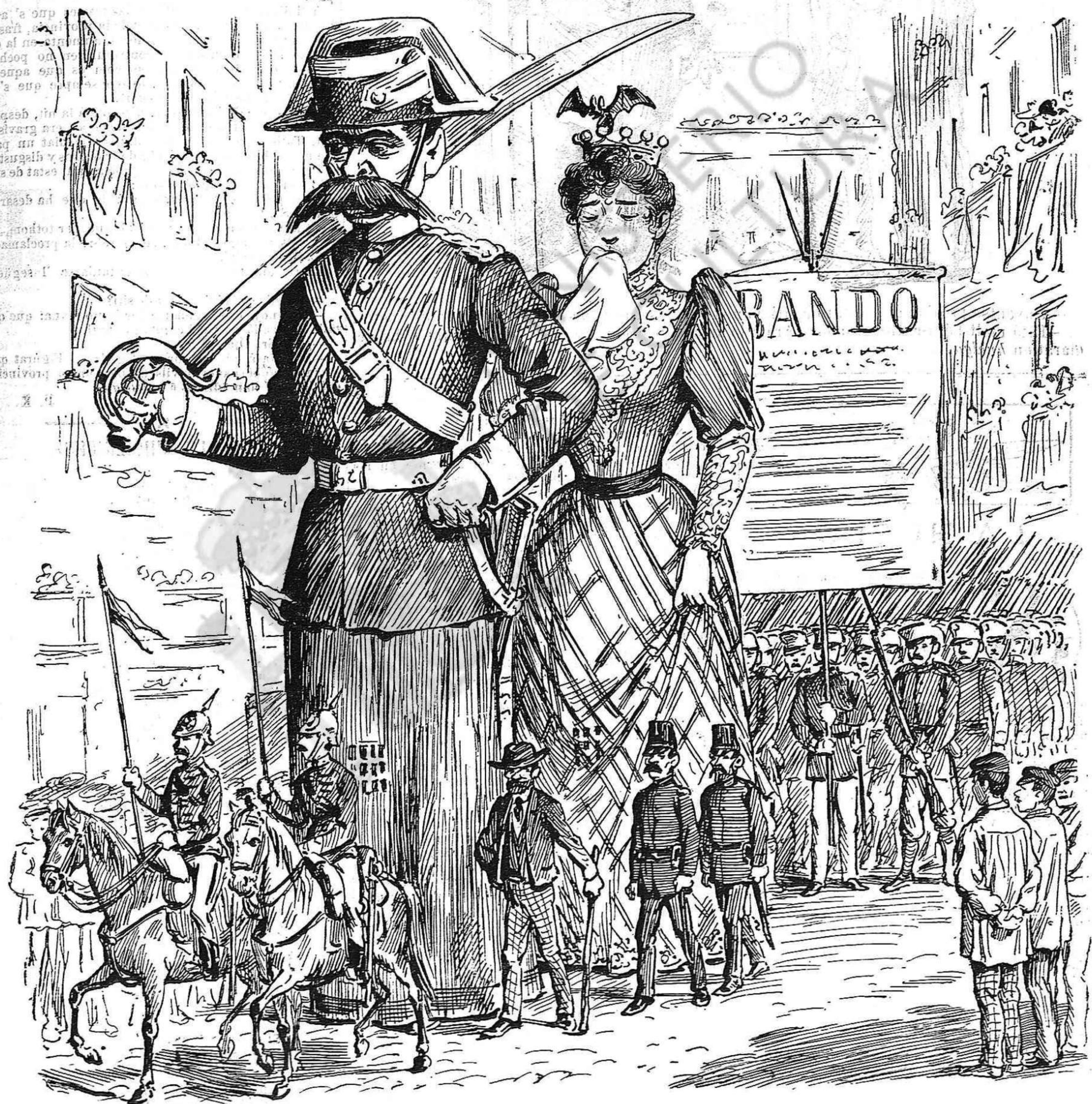
La professó del Corpus de aquest any