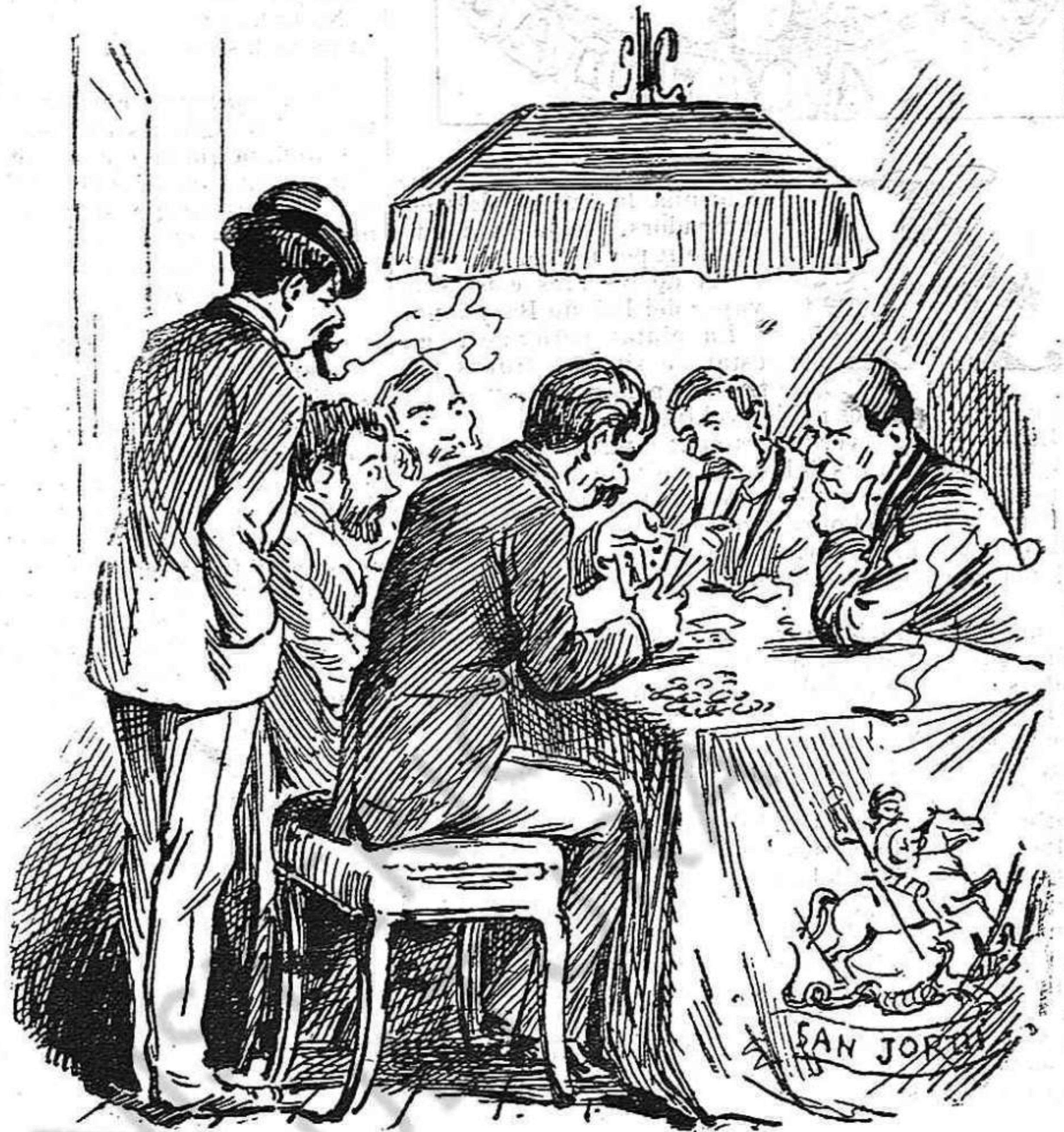
Mentres los obrers se declaran en huelga, en cambi aquets senyors treballan dia y nit y ningú 'ls empayta.

Y aixó que d' un quant temps á aquesta part las cosas no 'ls pintan gayre bè.