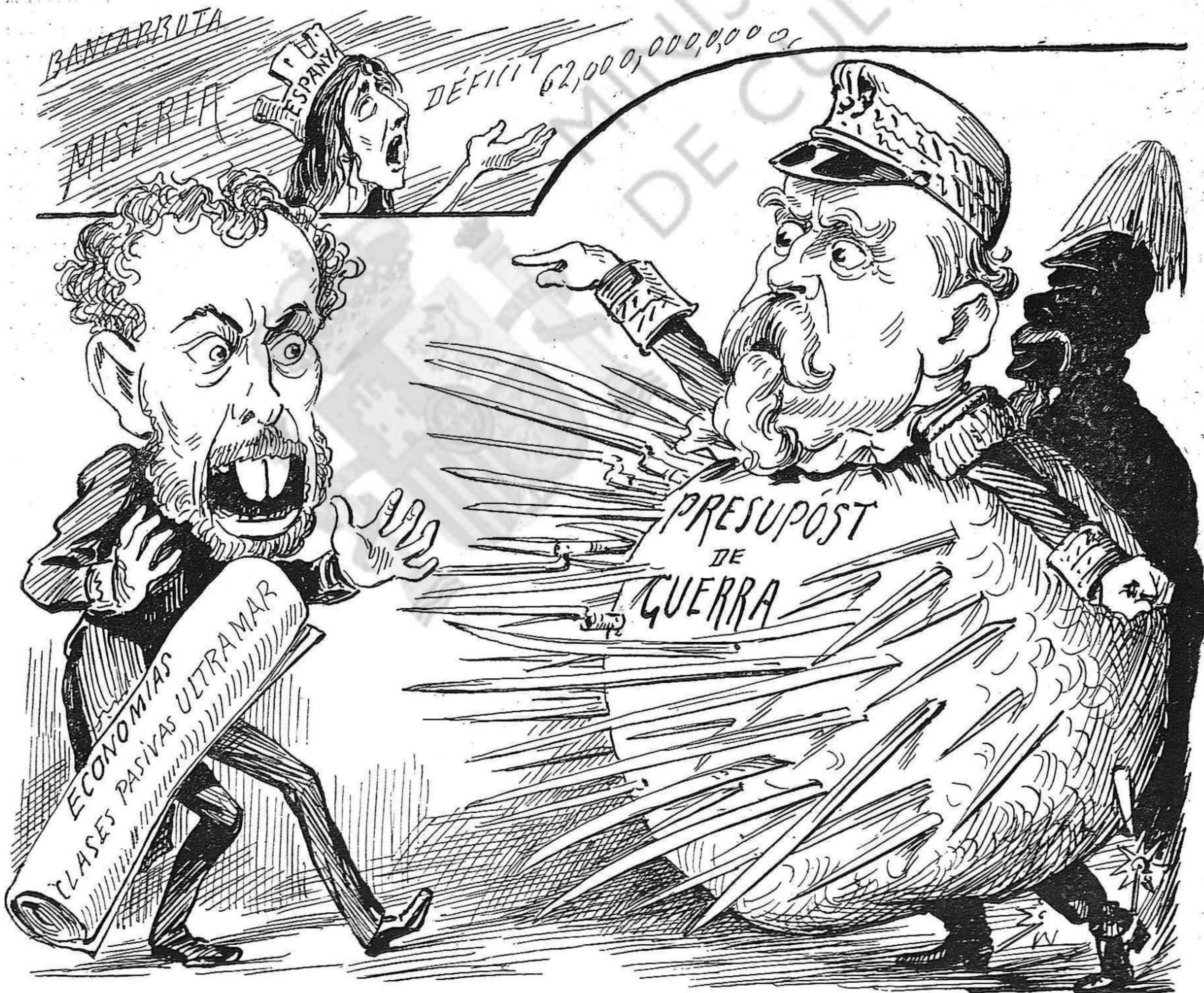
—Si 'ns toquéu ni un ral del sou potsé 'us farém un cap nou!