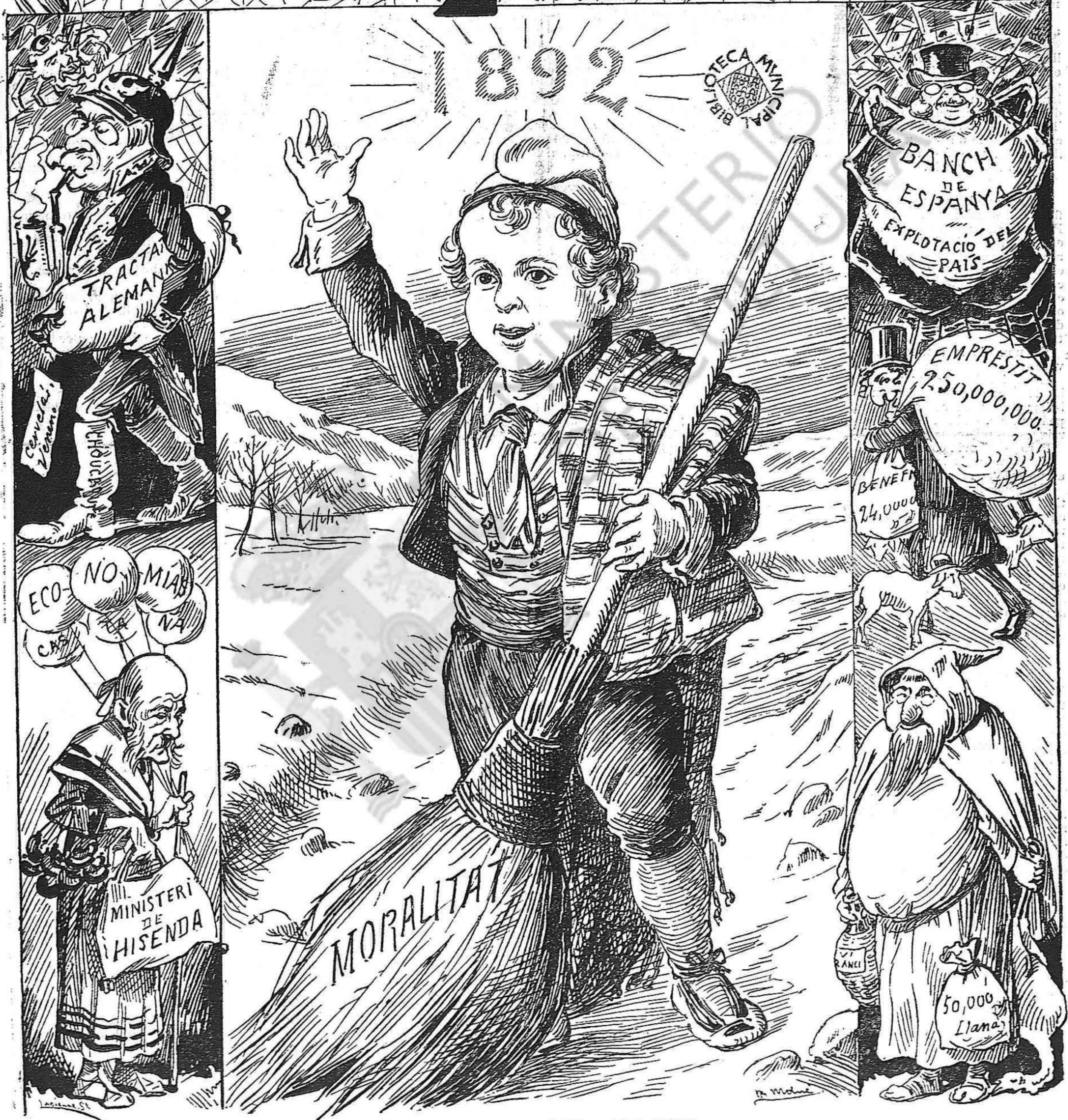
L' ARRIBADA DEL ANY NOU

¡Salut ciutadans, y si voleu passar un any felis, ajudeume á manejar l' escombra, y prompte farém net!