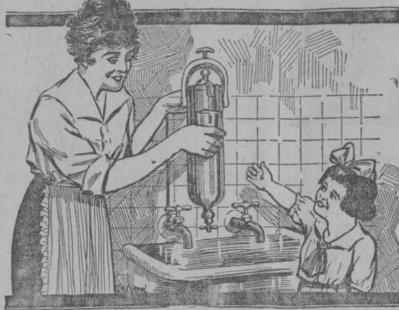
“El Beber Agua fría sin filtrar, es desprestigiar la vida” GALENO.

tage!... ¡qué cursilería tratándose de una festividad gorda! —Pues a ver que podemos, costando los frijoles un ojo de la cara... ¿Queréis capón relleno?