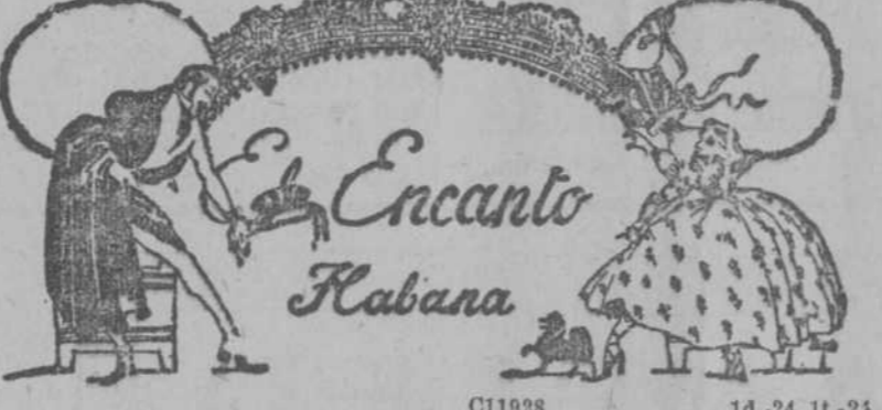
Encanto Habana. C11928 1d.-24 lt.-24

I Son hija y madre; y las dos con frío, con hambre y pena, piden en la Nochebuena una limosna por Dios. II —Hoy los ángeles querrán— la madre a su hija decía— que comamos, hija mía, por ser Nochebuena, pa. III Y al anuncio de tal fiesta abre la madre el regalo, y sobre él a aquel pedazo de sus entrañas acostada. IV Al pie de un farol sentada, pide por amor de Dios... Y pasa uno... y pasan dos... mas ninguno le da nada. V La niña con triste acento, —Pero, ¿y nuestro pan?— decía. —Ya llega— le respondía la madre... ¡Y llegaba el viento! VI Mientras de placer gritando pasa ante ellas el genio, la niña llora de frío, la madre pide llorando. VII Cuando otra pobre como ella una moneda le echó, recordando que perdió otra niña como aquella. VIII —¡Ya nuestro pan ha venido!— gritó la madre estasiada... mas la niña quedó echada como un pájaro en su nido. IX ¡Llama... y llama!... ¡Desvarío! Nada hay ya que la despierte: duerme, está helado, y la muerte sólo es un sueño con frío.