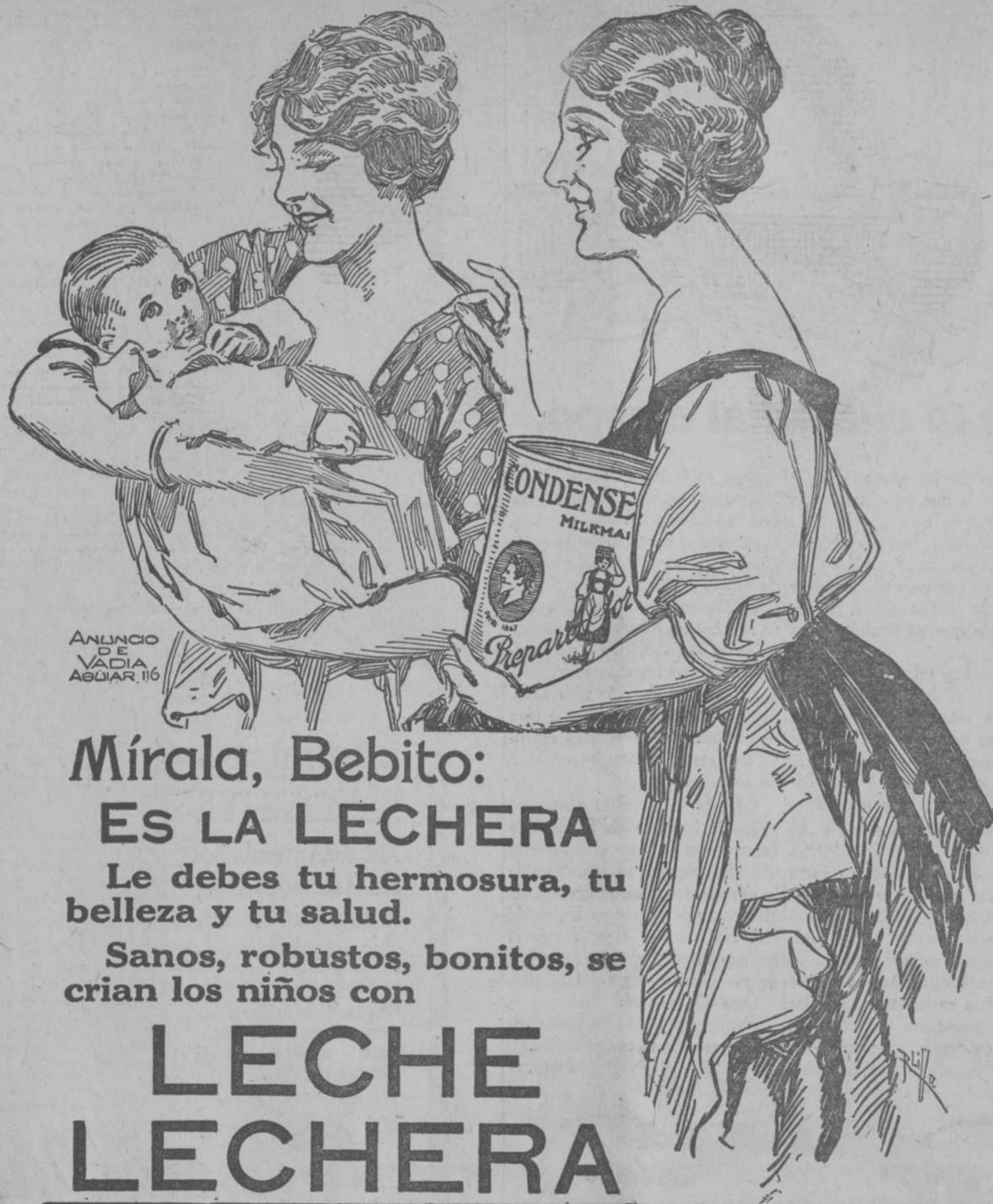
ANUNCIO DE VADIA AGUIAR 116