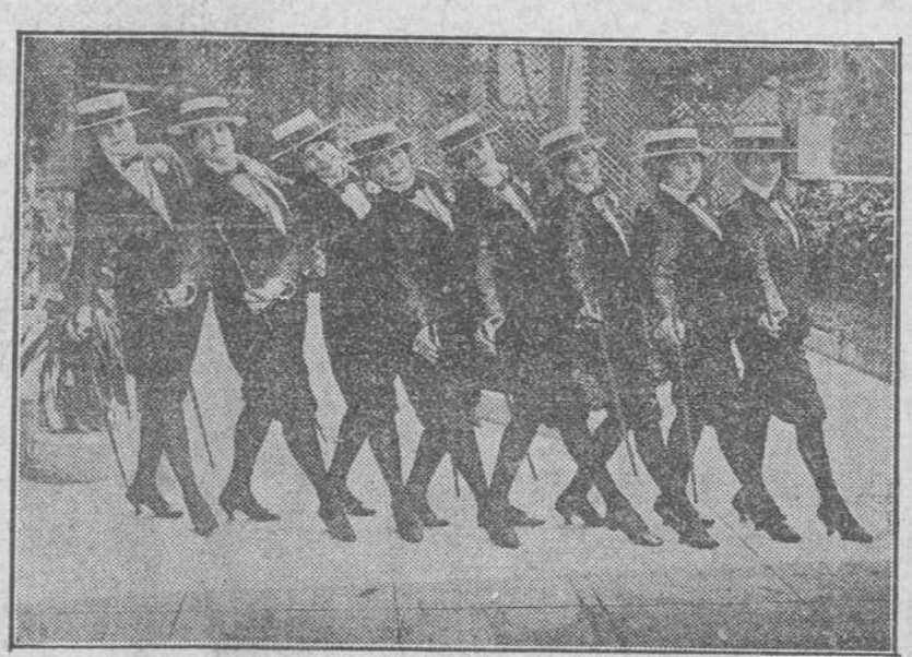
Caro de los monóculos de la interesante y sugestiva revista "La Liga de las Naciones", de la compañía de Velasco, que debuta mañana en el Nacional.

Simultáneamente los representantes diplomáticos rumanos en las varias capitales aliadas serán llamados por los Ministros de Relaciones Exteriores, quienes les explicarán el carácter reservado del ultimatum y la extrema gravedad de la situación que surgirá si Rumania se niega a acceder a lo que se le pide.