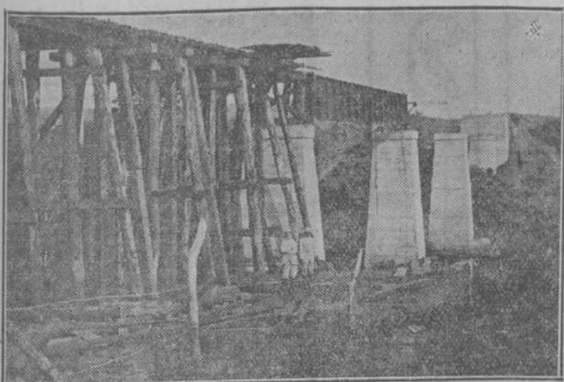
Ferrocarril de Placetas a Fernández, en construcción. Puento sobre el río "Agabama".