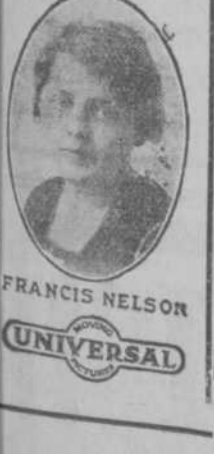
FRANCIS NELSON UNIVERSAL