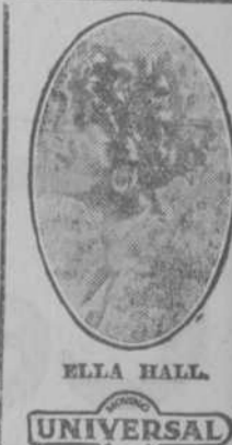
ELLA HALL UNIVERSAL

No deje de ir hoy al "Nacional" a pasar un buen rato.