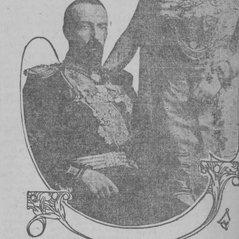
UN DUQUE PREMIADO POR SU HEROISMO.—EL Czar Nicolás de Rusia, le ha concedido como premio por su heroísmo y táctica militar a su hermano el gran duque Michael, el permiso de matrimonio con la condesa Brasof. La fotografía que aquí damos es la del gran duque, y la condesa.