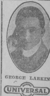
GEORGE LARKIN UNIVERSAL