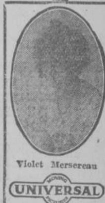
Violet Mercereau UNIVERSAL