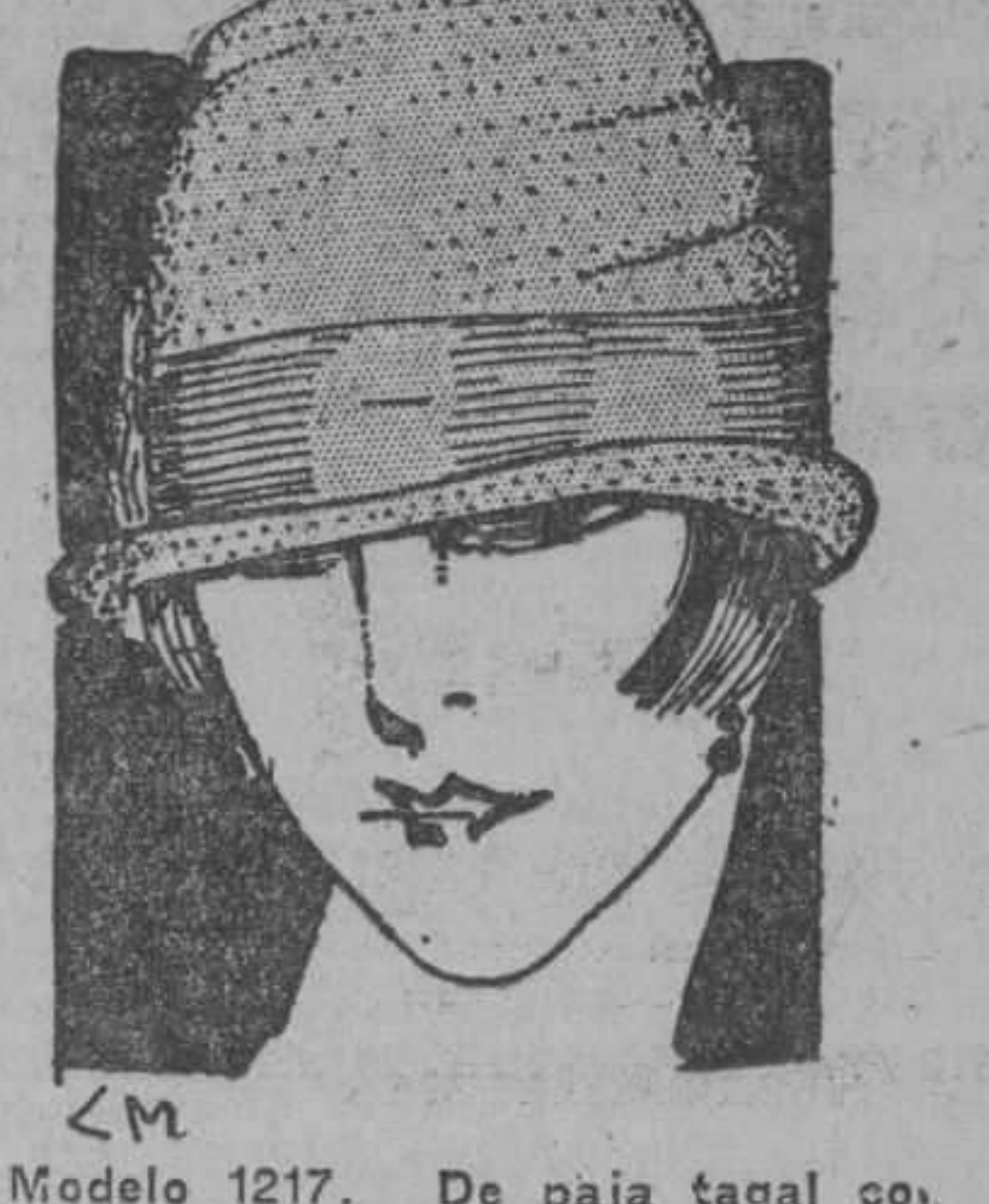
Modelo 1217. De paja tagal con pliegues en la copa y adornado con cinta de faya. Colores: negro, carmelita, embeleso, violeta, "bois de rose", rojo, blanco y verde oscuro. A $3.50.