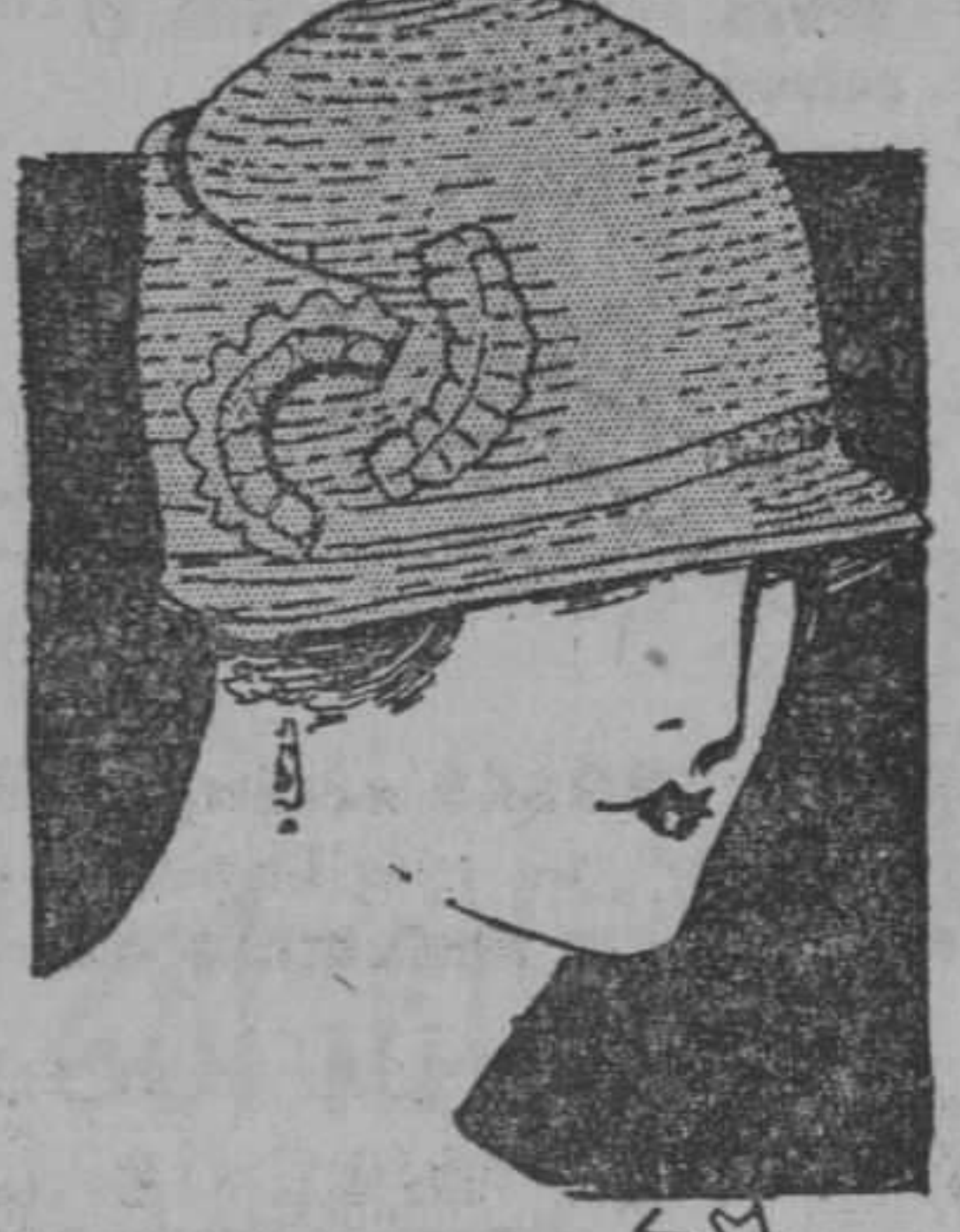
Modelo 412. De paja Visca. Elieque en la copa. Adorno de cinta de faya. Este modelo se repite en los colores rojo, verde, blanco, negro, "bois de rose", pastel y gris. Precio: $3.75.