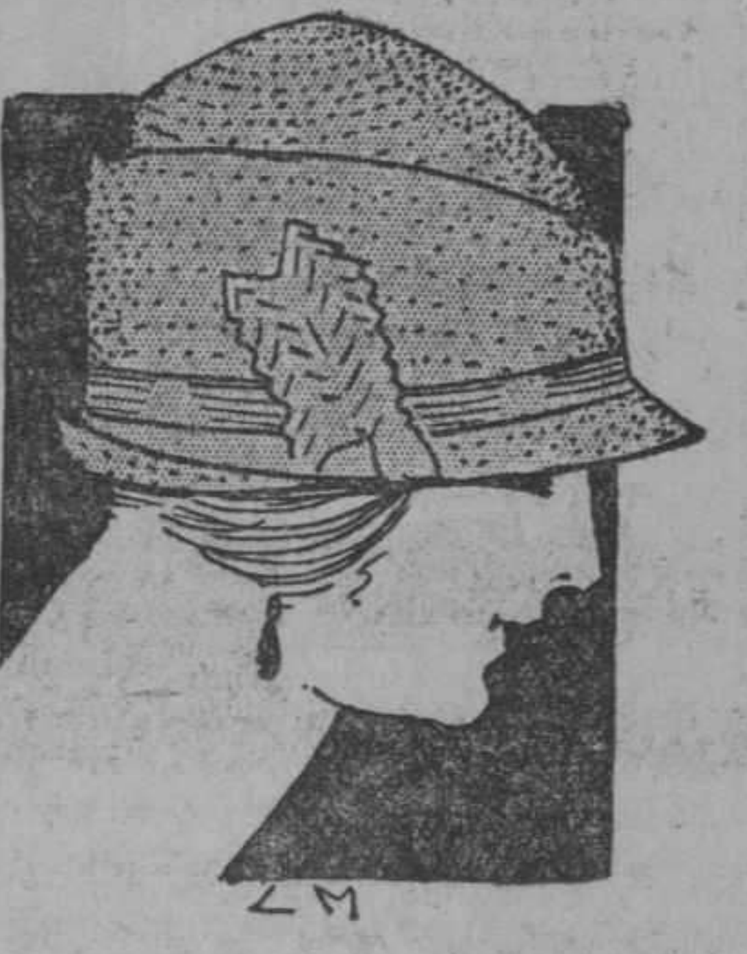
Modelo 1216. De paja muy fina, adornado con cinta. Colores: blanco, carmelita, negro, violeta, "bois de rose", rojo, verde y embeleso. A $3.25.