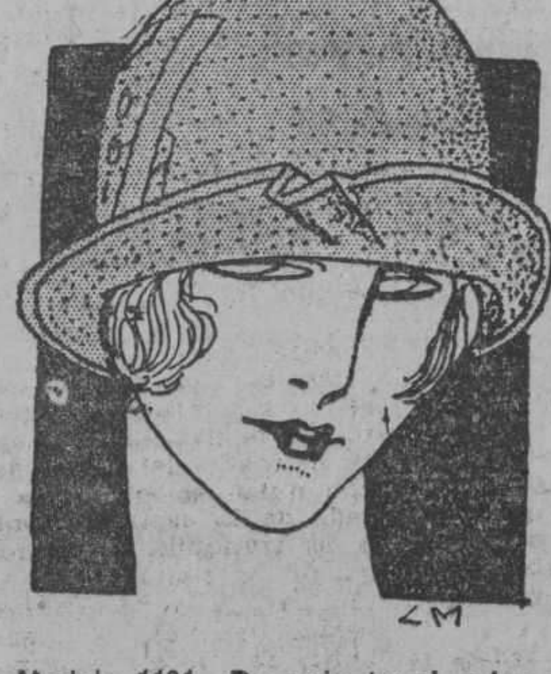
Modelo 1191. De paja tagal, adornado con cinta y un motivo decorativo de carey. En los colores rojo, blanco, negro, verde, morado, "bois de rose", tostado y embeleso. A $3.50.