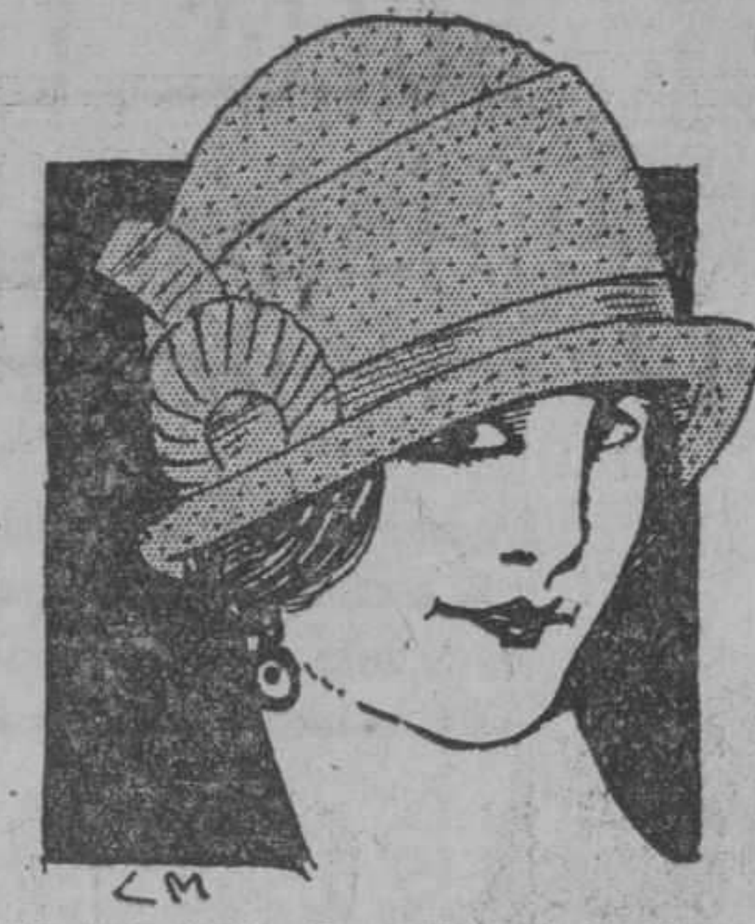
Modelo 1192. De paja tagal picot. Pliegues en la copa. Adorno de cinta de faya. Ha venido en los colores verde, embeleso, rojo, "bois de rose", tostado y blanco y negro. A $3.00.