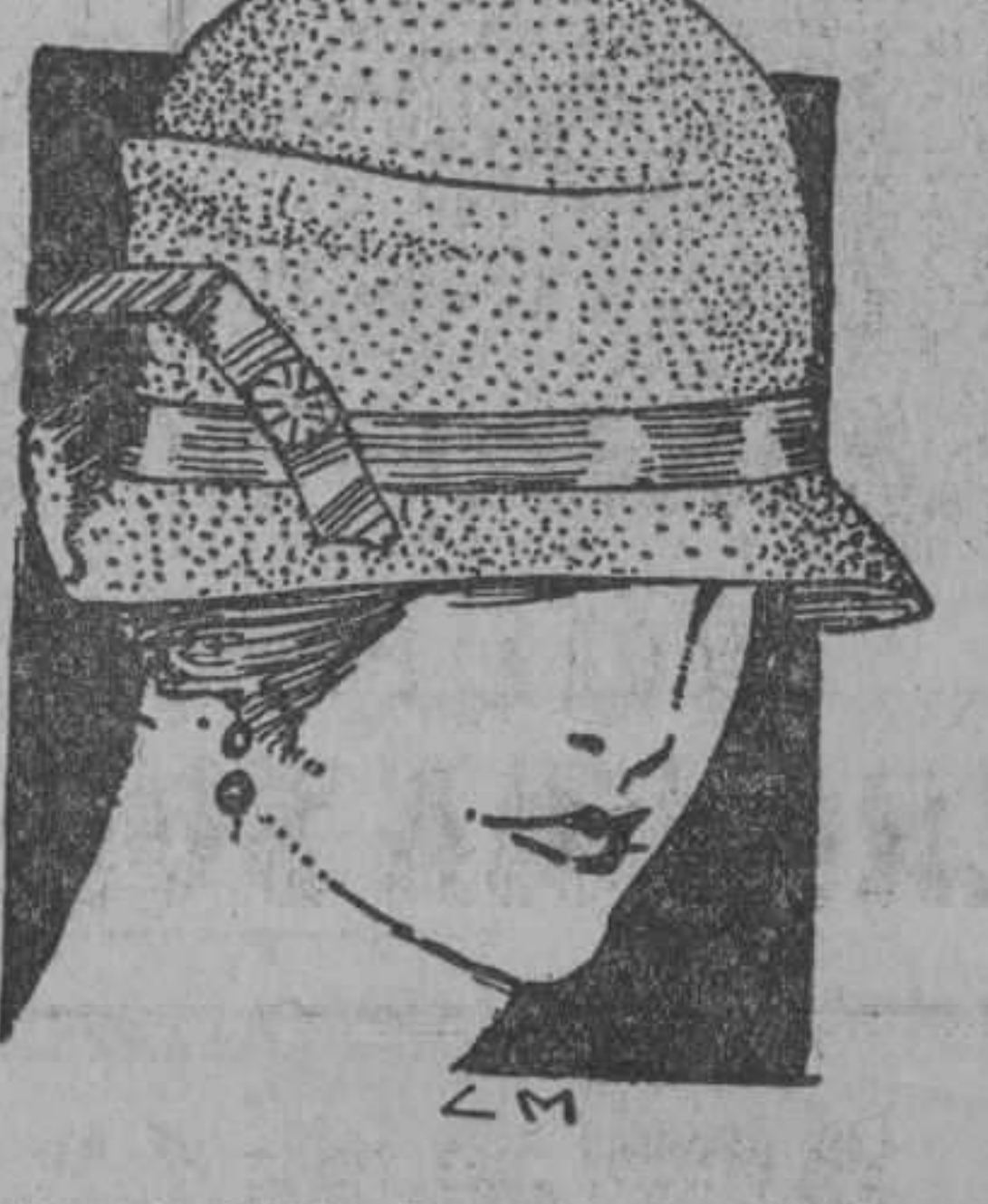
Modelo 1190. De paja tagal adornado con cinta de faya y pliegues en la copa. En los colores verde, blanco, "bois de rose", rojo, embeleso, tostado y negro. A $2.75.

Los sombreros franceses que hemos puesto a la venta en la Sección Especial tanto han gustado, y tan baratos les han parecido a nuestras estimadas favorecedoras, que muchas de ellas se han llevado colecciones completas. Sin perjuicio de llevarse, además, varios modelos finos, cuyo gran éxito se reproduce todos los días. Ambas secciones de sombreros —la de los finos y la Especial— constituyen en estos momentos una de las más poderosas atracciones de El Encanto.