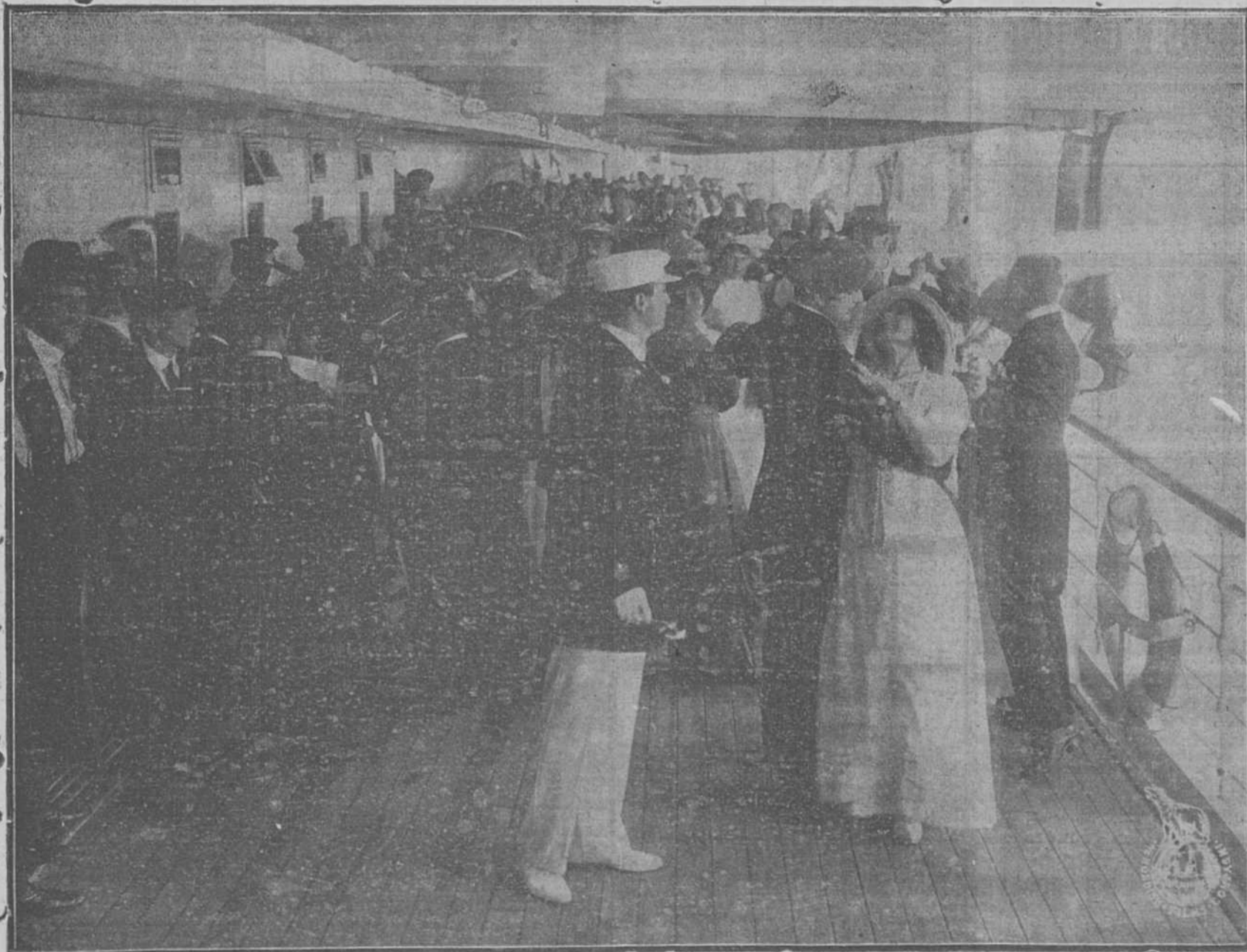
INTERESANTE ESCENA DE ESTA PELICULA QUE BATIRA EL RECORD DEL EXITO.

NO OLVIDARLO "ATLANTIS NORDISK" UNICAMENTE EL LUNES 5, EN EL POLITEAMA