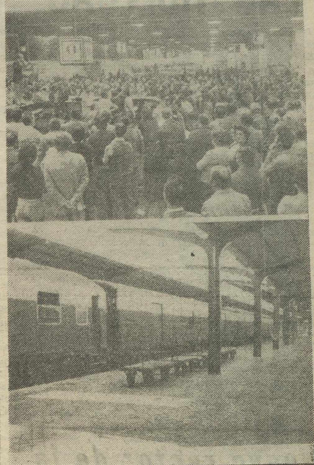
MADRID. — Arriba: Asamblea de trabajadores de RENFE en el vestíbulo de la Estación de Chamartín, durante las dos horas de paro total en todos los servicios de la red. Abajo: Los andenes de la Estación de Chamartín completamente vacíos durante las dos horas de paro.

La huelga en Albacete, sin novedad. (Información en pág. 5).