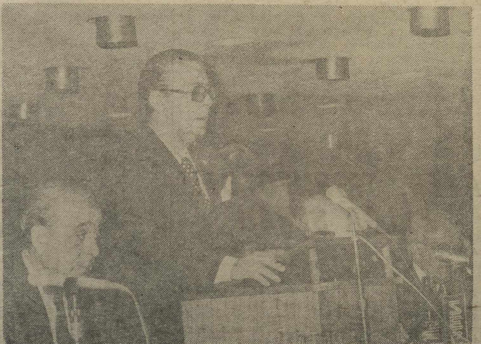
MADRID. — Don Pablo Porta, presidente de la Federación Española de Fútbol dirigiéndose a los asambleístas al iniciarse la celebración del pleno del fútbol español.

Sábado, 9 de julio de 1977 - Teléfonos - 226050 - 226054