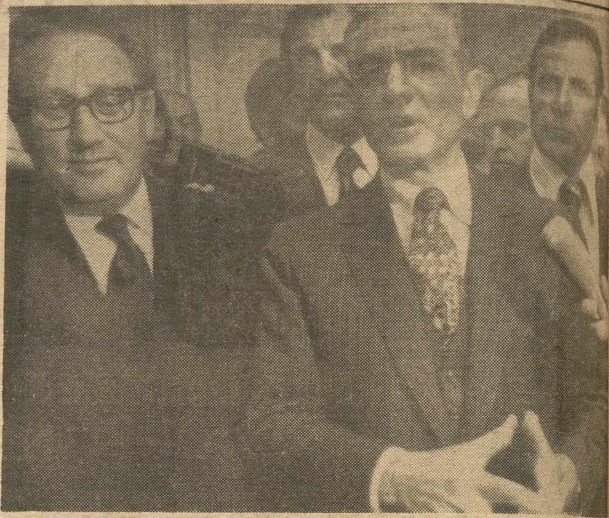
ZURICH.—El Sha del Irán contestando a los periodistas en presencia de Henry Kissinger, después de la entrevista que ambos mantuvieron en Zurich.