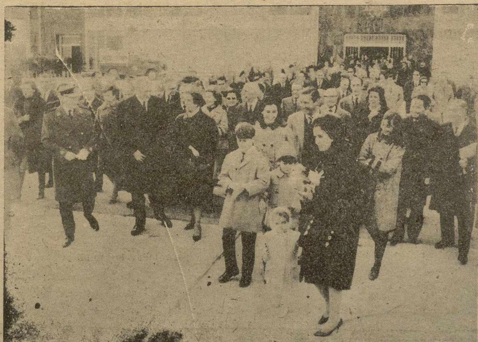
La misión oficial española que va a visitar Filipinas, Laos, República China (Formosa) y Japón, presidida por el ministro de Asuntos Exteriores, don Fernando María Castiella y en la que figuran los marqueses de Villaverde, hijos del Jefe del Estado, a su salida del aeropuerto de Barajas (Madrid). Entre otras personalidades acudió a despedirla la esposa del Jefe del Estado, doña Carmen Polo de Franco.