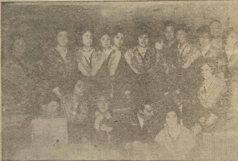
Esta fotografía corresponde al Grupo de Danzas "Nuestra Señora de los Llanos" de