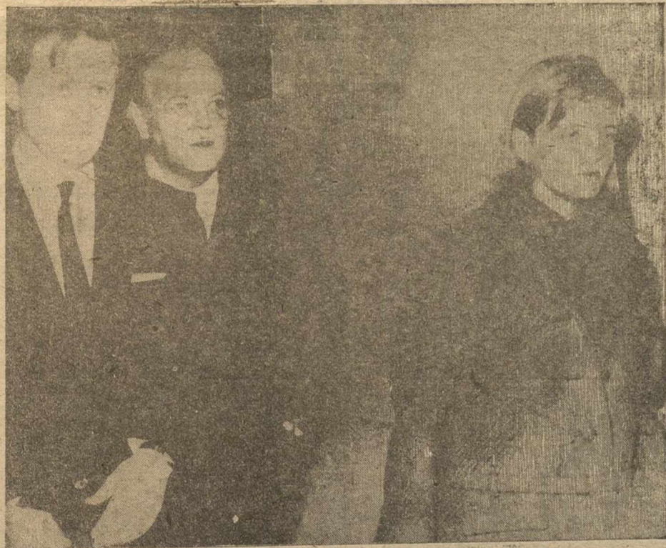
Winston Churchill, con su padre, Randolph, y su hermana, Arabella, llega a Hyde Park Gate, número veintiocho, para visitar a su ilustre abuelo, del que hereda el nombre y el apellido.

Su sistema circulatorio comienza ya a fallar