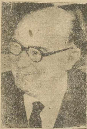
Director de LA VOZ DE ALBACETE, ALBACETE.

«Pero Albacete -añade el antiguo catedrático de nuestra Escuela Normal- tiene derecho a muchas cosas, y debe acelerar su crecimiento incrementando sus bases industriales y económicas»