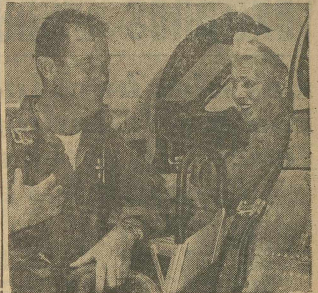
La mujer, en su afán de emulación de las hazañas del hombre, no tiene límites. Y se ha lanzado al espacio, montada en alados corceles, como si tal cosa. Véase en la foto a Jacqueline Cochran, nada menos que teniente coronel del Cuerpo de Reserva de la Aviación militar norteamericana después de un vuelo «supersónico», el primero de Fémia aviadora.