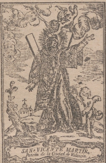
SAN VICENTE MARTIR

Se conservan para esta capilla varias reliquias de San Vicente y una escultura del Santo yacente, que será instalada en la cripta.