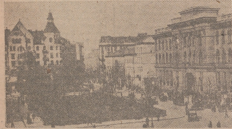
Una vista de Varsovia, la capital de Polonia, antes de la guerra

Decreto por el que se modifican algunos artículos del reglamento de Agentes Comerciales de 21 de febrero de 1942. — Decreto conjunto de los Ministerios de Industria y