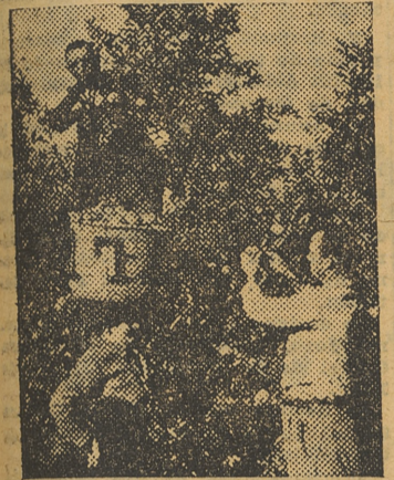
La producción de la naranja, cuyo tema será objeto de estudio en el próximo Consejo de Ordenación Económica

El periodista, pese a los que creen lo contrario, o es discreto o no es periodista. La norma más elemental de su profesión le aconseja no divulgar la fuente informativa, si