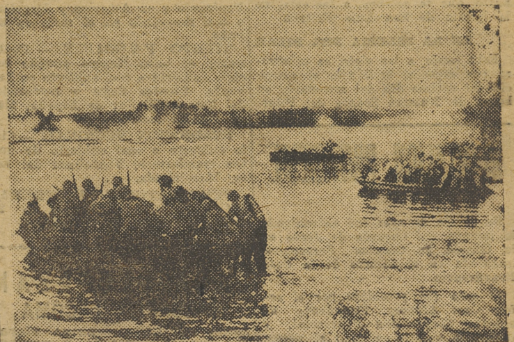
Protegidos por columnas de humo, los soldados finlandeses se aprestan a atravesar un río

EN 3.ª PAGINA: Interesantes declaraciones del Delegado Provincial de Sindicatos, para "JORNADA"