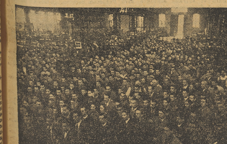
Un grupo de productores, valencianos, congregado para la conmemoración del Fuero del Trabajo

Abandonamos la gran celmana humana que es el edificio de la Delegación Provincial de Sindicatos, convencidos de que no hemos perdido el día, pues llevamos para nuestros lectores una información de importancia trascendental.