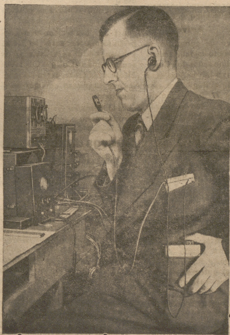
Demostración práctica de un equipo de radio receptor y transmisor conocido por Tele Radio