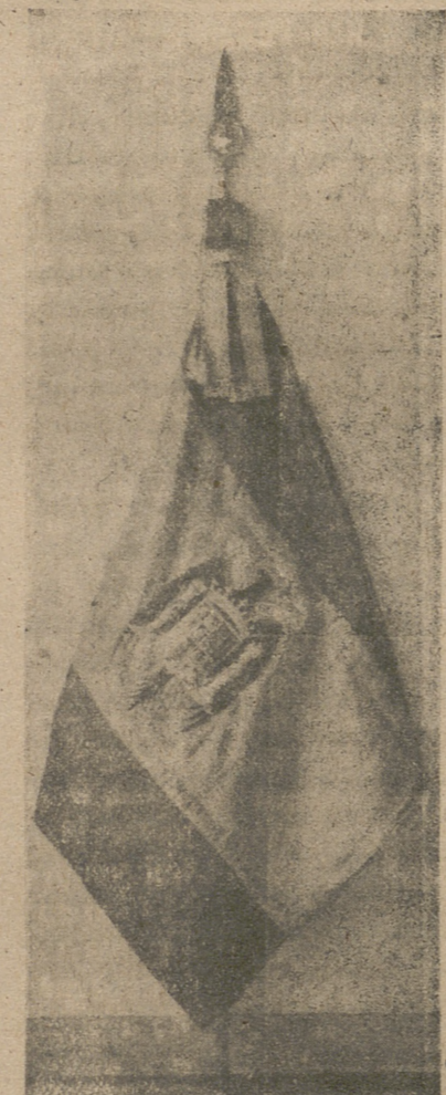
La Bandera de Intendencia esplende con las glorias conquistadas por los que ante ella recibieron el espaldarazo de Caballeros.

VICTORIA PLANCHADORA Paseo de Santo Tomás, 38. Se reciben encargos en Tomás Luis de Victoria, 11, pral., derecha. (No confundirse, entrada junto a la carbonería).