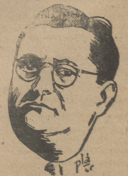
Jaques Doriot, jefe del Partido Popular Francés y presidente del Comité de Liberación Francés en Alemania, que ha sido víctima de un atentado.

Por el enorme interés que para Castilla la Vieja y León, como fuentes principales de la riqueza agrícola, ganadera y forestal de España, supone el Congreso, en todas las ciudades y pueblos de ambas regiones, ha sido recibido con verdadero entusiasmo, como se recoge de los testimonios que se reciben de multitud de agricultores y ganaderos.—CIFRA.