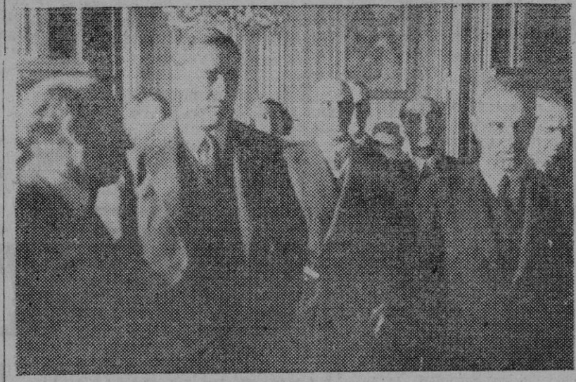
Madrid. — El Excmo. Sr. Ministro de Agricultura camarada Miguel Primo de Rivera da posesión del cargo al nuevo Director General de Montes don Salvador Robles Trueba.

La mira "Norden" se encuentra montada detrás de un panel de vidrio de cierto espesor, en el compartimiento del bombardero en la proa del avión. Generalmente antes de realizar el vuelo de prueba sobre el blanco, el bombardero ajusta la mira a una altura y velocidad propuestas. Luego viene el ajuste del giroscopio de la mira, el cual ha de girar con su eje perpendicular a la tierra, orientando la mira en el verdadero rumbo del avión y sirviendo de preparación