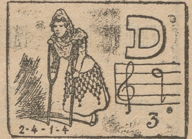
Las soluciones en el próximo número.

En el centro de esta población se vende una casa.