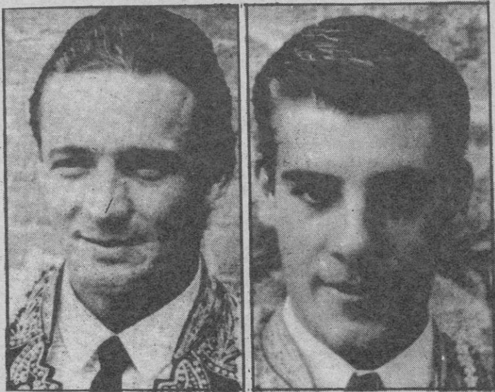
Manzanares y Litri.

Tres cuartos de entrada en La Maestranza, en tarde nublada y con viento.