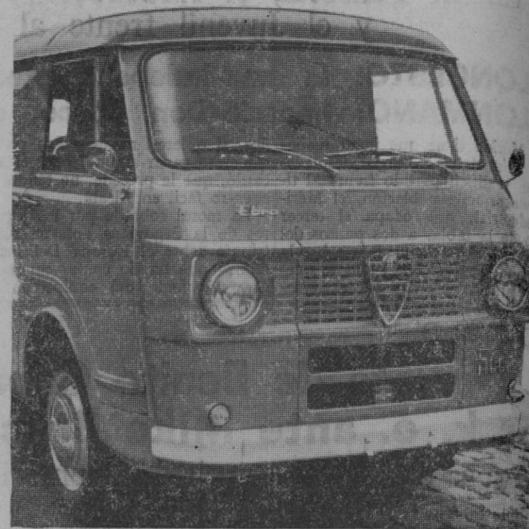
El vehículo insuperable para llevar 1.000 Kgs.

Fabricado por FADISA, con garantía y asistencia técnica EBRO en toda España.