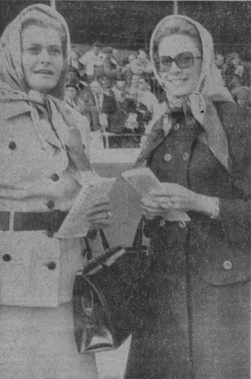
New Jersey.—La princesa Grace de Mónaco en el Garden State Park con su hermana, la señora Donald Levine, de soltera Lizzanne Kelly, esposa de uno de los más importantes criadores de caballos de pura sangre de New Jersey. Las señoras parecen divertidas por algo de sus programas. La princesa está de visita en su casa de soltera, en Filadelfia, con su familia.