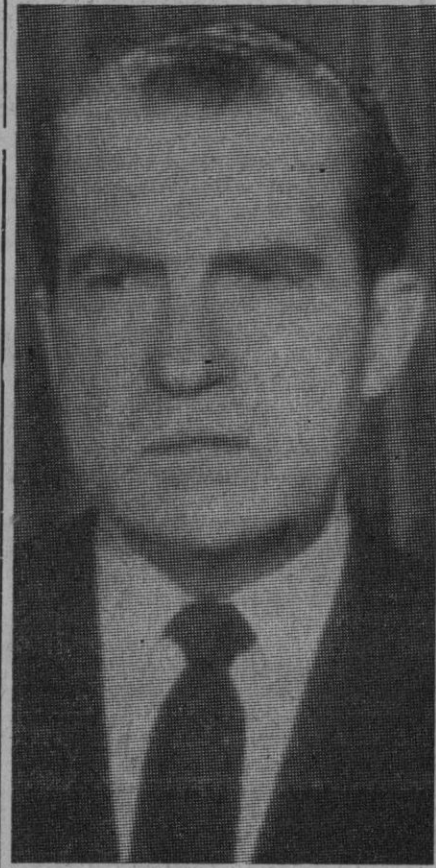
El presidente de los EE. UU., Richard Nixon