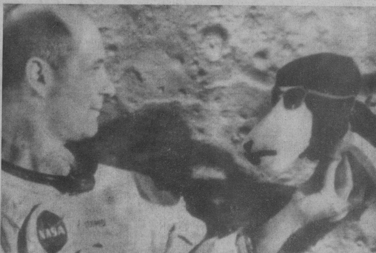
Cabo Kennedy.—Thomas Stafford comandante de la nave espacial «Apolo 10», ante un fotograma de la Luna, en Cabo Kennedy. En su mano sostiene la marioneta «El perro Snoopy». Stafford y sus copilotos Eugene A. Cernan y John W. Young han elegido la palabra «Snoopy» como su código de radio en las comunicaciones que mantendrán del módulo lunar a la cápsula, cuando aquél se acerque a ocho millas de la Luna.

cuencia de la invasión de Checoslovaquia por parte de Rusia y las potencias del Pacto de Varsovia. Se espera que Rusia acepte la iniciación de las conversaciones si bien en fuentes comunistas se ha indicado que Rusia preferiría que las conversaciones se celebraran en Viena.—Efe-Upi.