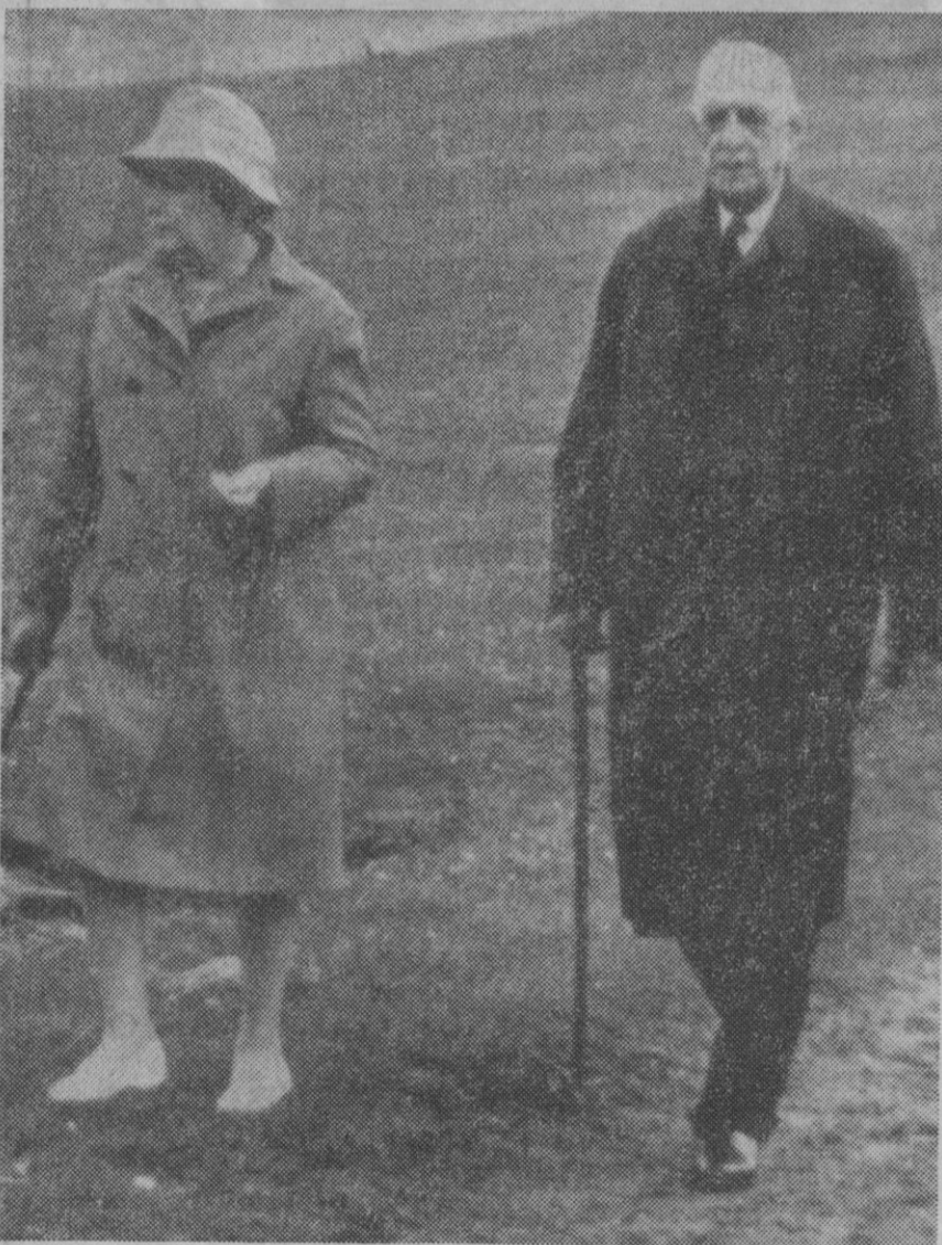
Irlanda.—El general De Gaulle, acompañado de su esposa, pasea por los campos de Killarney, donde se encuentra pasando unos días de descanso, tras su súbita salida de Francia días pasados.

Aunque la entrada de anchoa en el puerto de Bermeo ha sido muy elevada (500.000 kilos el pasado sábado, 100.000 el domingo), los precios siguen siendo muy altos, rebasando las 50 pesetas kilo.