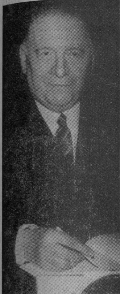
Alain Poher, Presidente interino de la República Francesa

Vigo, 13.—Trescientas cincuenta novillas de la raza «frisona», cuyo valor total se acerca a los trece millones y medio de pesetas, se han desembarcado del carguero holandés «Frisian Express», acoderado al muelle del Comercio, en el puerto de Vigo. Del total de novillas, 212 se destinan a la provincia de Pontevedra, y el resto se distribuirán entre los diversos ganaderos de las provincias de Avila, Zamora, Toledo, Lugo y Orense.—Cifra.