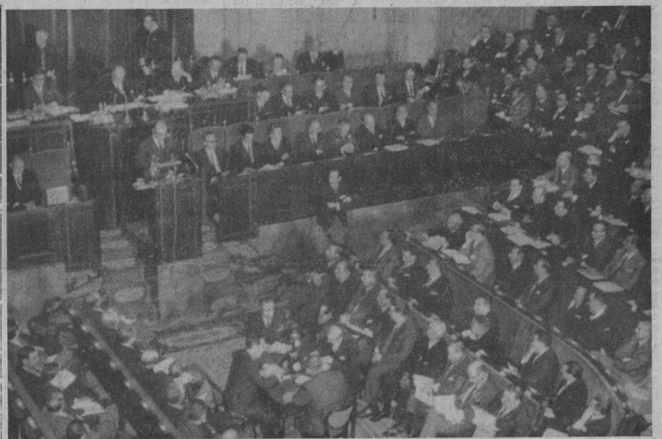
Madrid.—Vista general de las Cortes Españolas mientras el vicepresidente del Gobierno, almirante don Luis Carrero Blanco dirige la palabra al Tercer Pleno de la IX Legislatura, esta mañana.