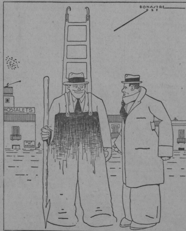
—Oh!, la vida en este barrio es divertidísima. Figúrate que en invierno, se convierte en un cenagal; y para entrar en casa, lo hacemos por el balcón.