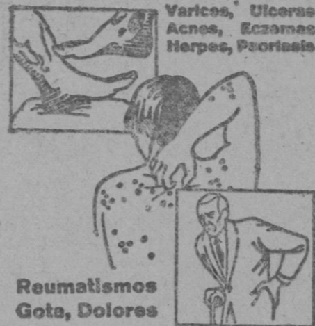
Varicosas, Úlceras, Acnes, Eczemas, Herpes, Psoriasis

Si no se dispone otra cosa, siguiendo la costumbre establecida, las vacaciones de Navidad deberán empezar el día 16 del corriente, en todos los centros de enseñanza.