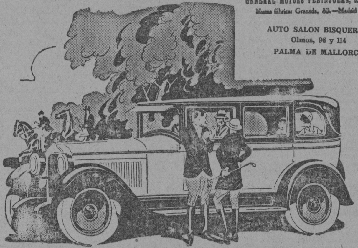
Fisher ha puesto en las carrocerías del Pontiac el sello de elegancia que siempre le caracteriza

GENERAL MOTORS PENINSULAR, S. A. Nuestro fábrica: Granada, 83.—Madrid