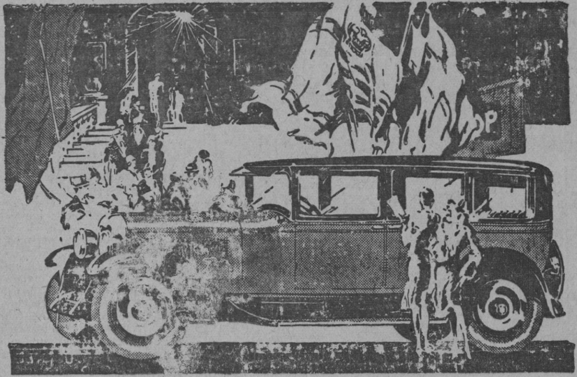
La elegancia y distinción caracterizan al nuevo Oakland 1928