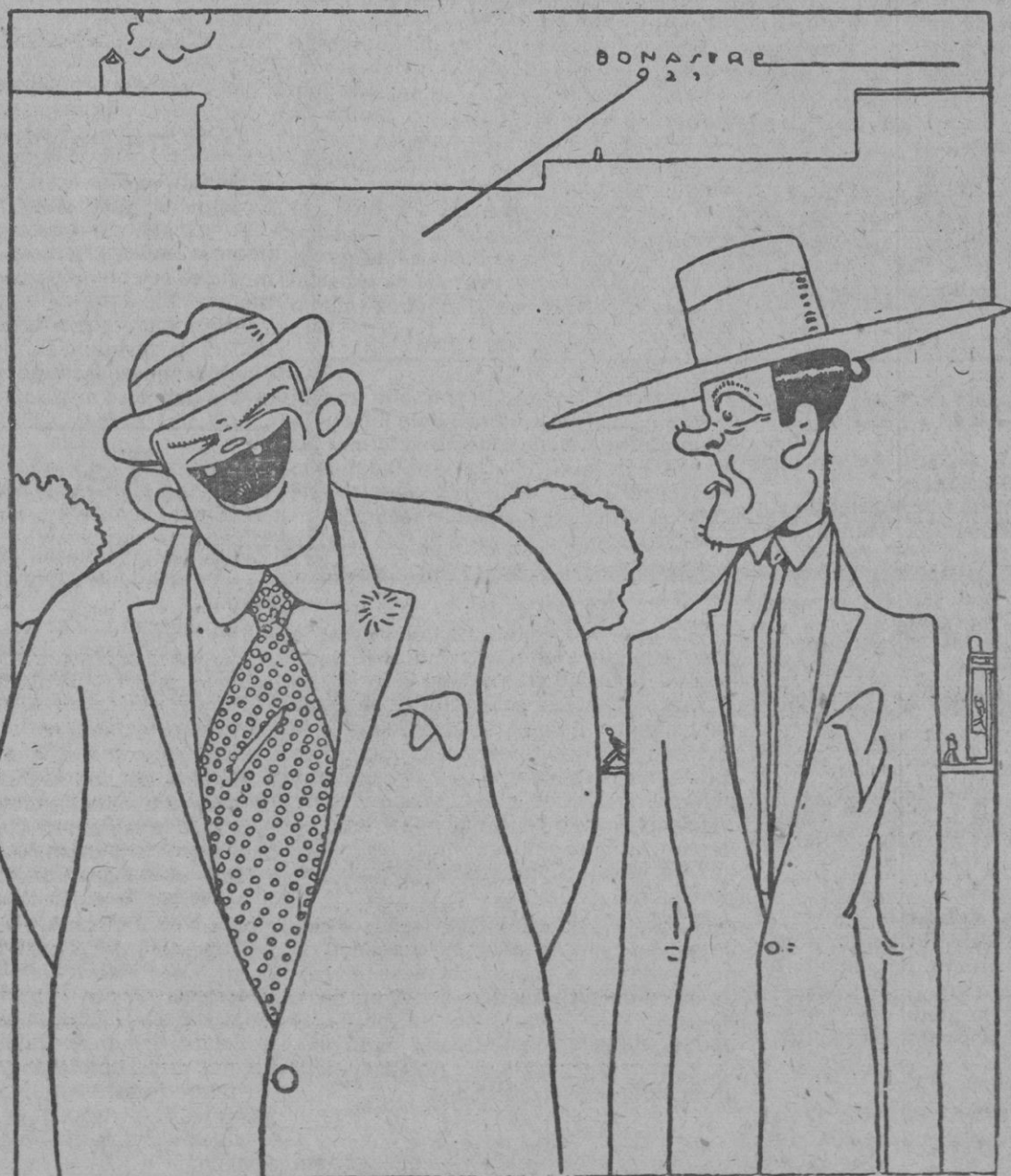
—Sí, hombre sí; soy tan entusiasta como tú de los toros. Pero... te parece bien que me deje la coleta, ahora que mi mujer lleva el pelo corto?...