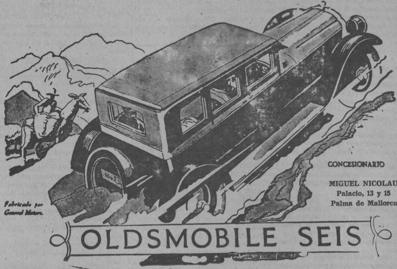
Fabricado por General Motors.

GENERAL MOTORS PENINSULAR. S. A. Nueva fábrica: Granada, 53.—MADRID