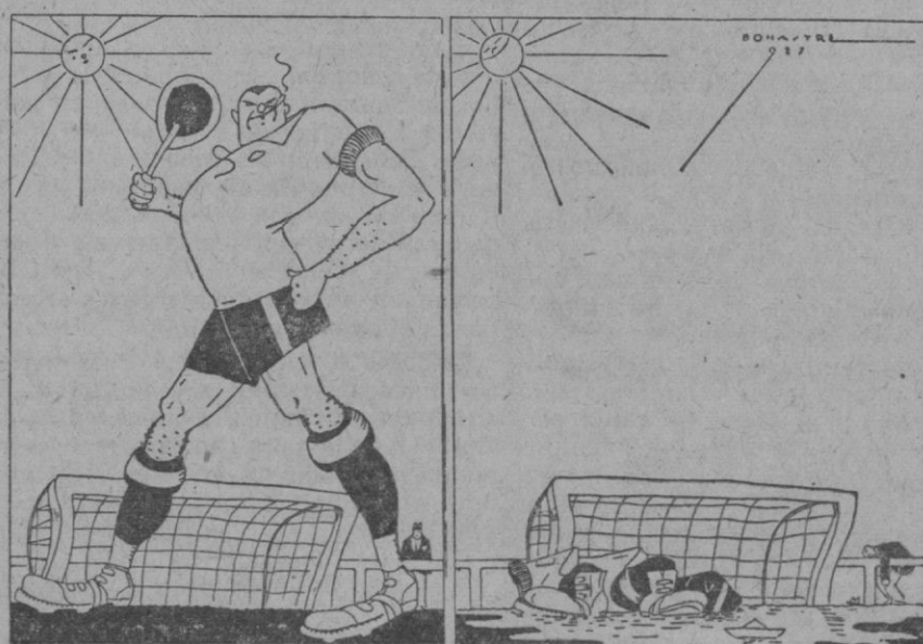
Antes y después del partido