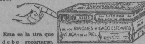
Esta es la tira que debe recortarse.

Representantes generales para España: Establecimientos Dalmau Oliveres, Sociedad Anónima. P.º Industria, 14. Barcelona.