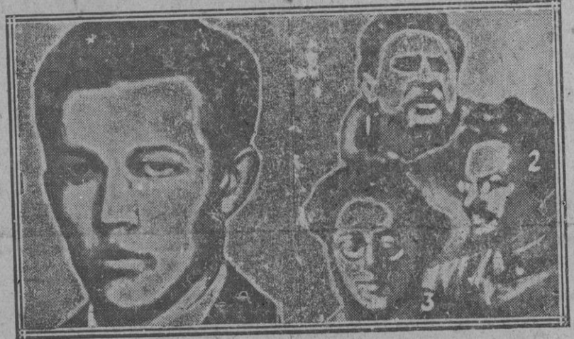
1. El joven monárquico ruso Boris Coverda que ha asesinado al ministro de su país en Varsovia.—2. Los «prohombres» comunistas Zinovief (1), Trotsky (2) y Radek (3), que, según parece, serán deportados a Nasm.