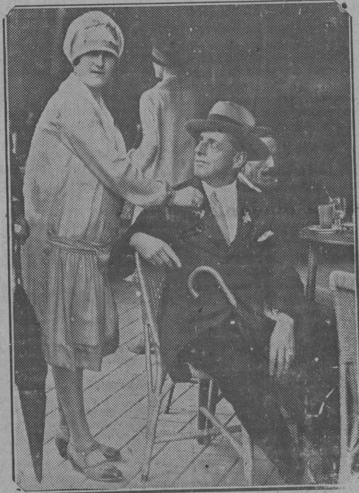
La Fiesta de la Flor.—Un sablazo que no duele