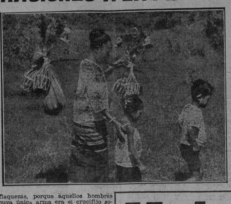
La esposa de Ghan-Kai-Chek en una reciente declaración a la prensa.