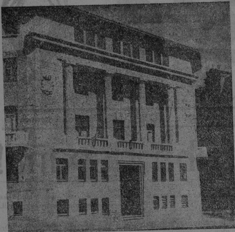
El edificio que ocupa el Ministerio de Organización y Acción Sindical