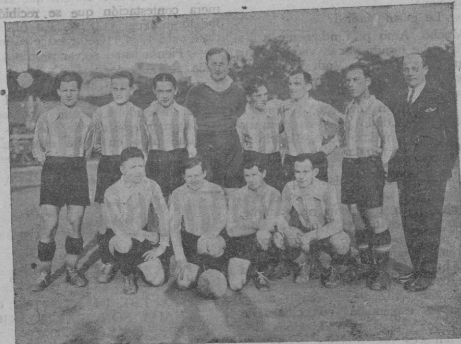
El «Meteor» de Praga, que el próximo sábado y domingo contendrá con la R. S. Alfonso XIII