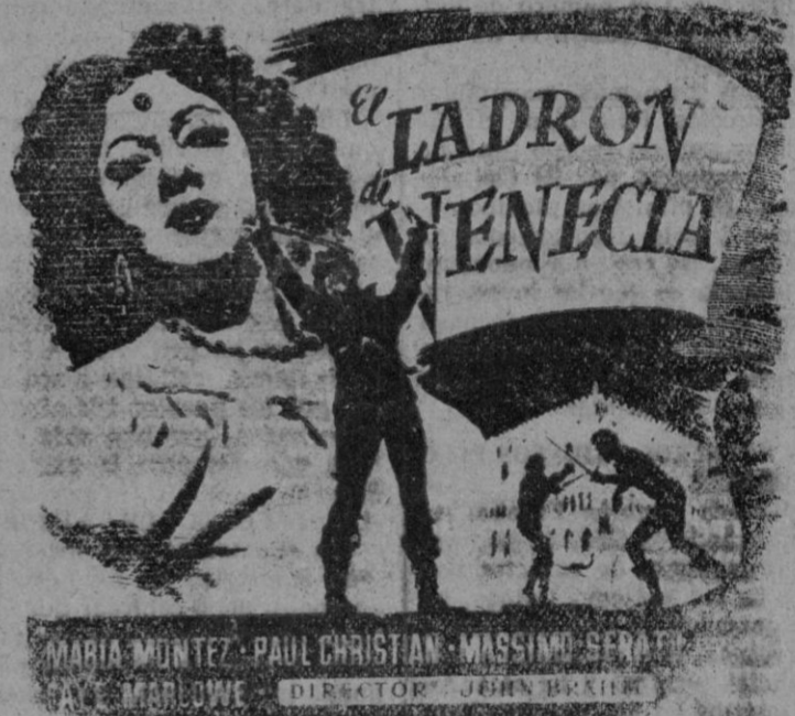
La interpretación cumbre de la malograda MARIA MONTEZ

UN FILM QUE SE INCORPORA A LOS ANALES DE LA CINE-MATOGRAFIA CON LA TALLA DE UN GIGANTE INTRIGAS, AMOR Y AVENTURAS EN EL MARCO Suntuoso DE VENECIA