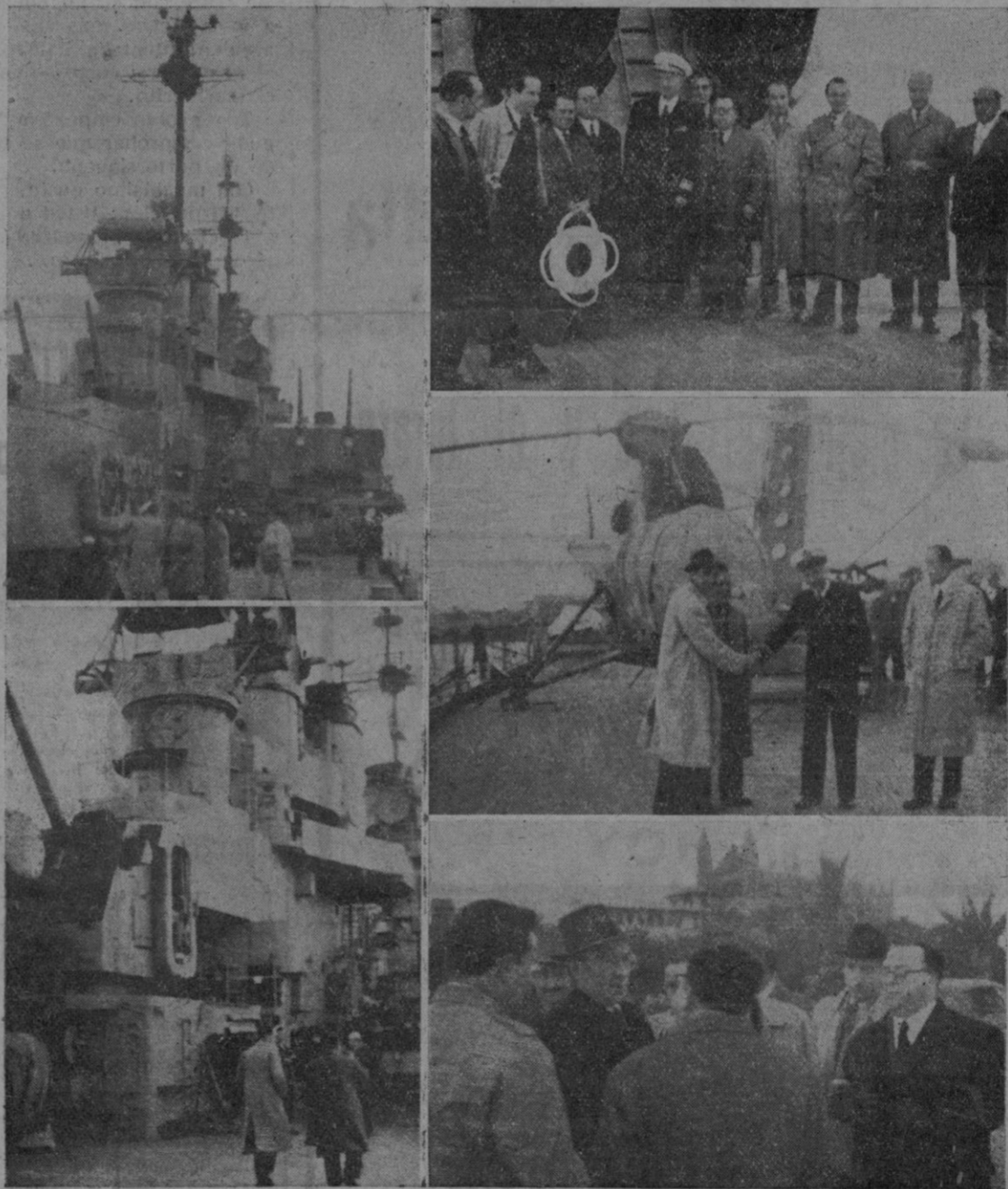
Reportajes Palma, nuestro servicio de información gráfica, ofrece el adjunto fotomontaje de la visita de la prensa al buque insignia de la División Naval norteamericana surta en Palma.

Véanse en las dos fotografías verticales una de la cubierta del crucero "Macon" y otra, con más detalle, de las torres del mismo. En las fotos apaisadas al Contralmirante Parsons y los redactores de los diarios de la ciudad, acompañados de norteamericanos y palmesanos, retratados a bordo del navío; la afectuosa despedida a nuestro redactor al emprenderse el regreso, y el Adjunto naval de la Embajada de los Estados Unidos conversando en el desembarcadero con nuestros compañeros de profesión.