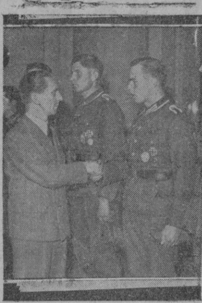
EL DR. GOEBBELS FELICITA A LOS COMBATIENTES DEL ESTE.—Un grupo de combatientes del Este, condecorados por su especial actuación, ha sido recibido en Berlín por el Dr. Goebbels que les felicitó.

El enemigo contaba con ocho unidades y nosotros con solo una el tonelaje británico se elevaba a 78.825 y el alemán a 26.000. Además el adversario dispuso de 286 cañones de todos los calibres, mientras nosotros tuvimos 51.