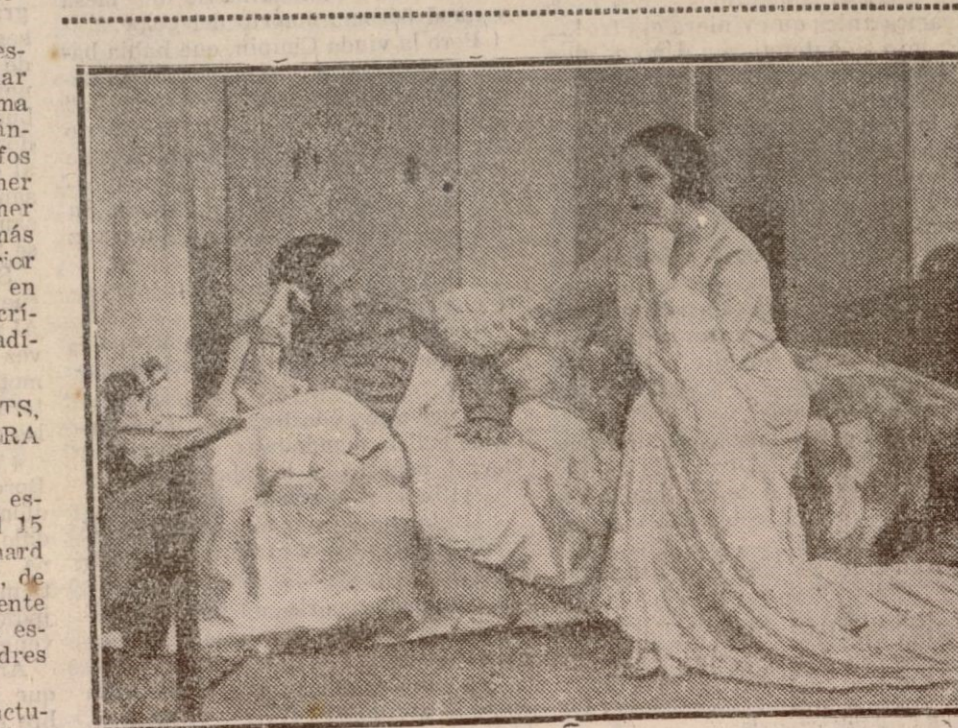
MADRID.—Una escena de "El balcón de la felicidad" comedia de Honorio Maura, que es cotreado en el teatro Fontalba con gran éxito.

En el Teatro des Arts, de París, estaba anunciada el estreno para el 15 de este mes de una obra de Bernard Shaw: "Troyal pour être honnête", de la cual ya hemos hablado brevemente en esta sección con motivo de su estreno en Alemania y que en Londres ha obtenido un gran éxito. La obra de que se trata es de factura muy diferente a la de "Santa Juana", del mismo autor y de tendencias muy avanzadas. Su acción se desarrolla en un gran hotel de Londres y después en las colonias inglesas.