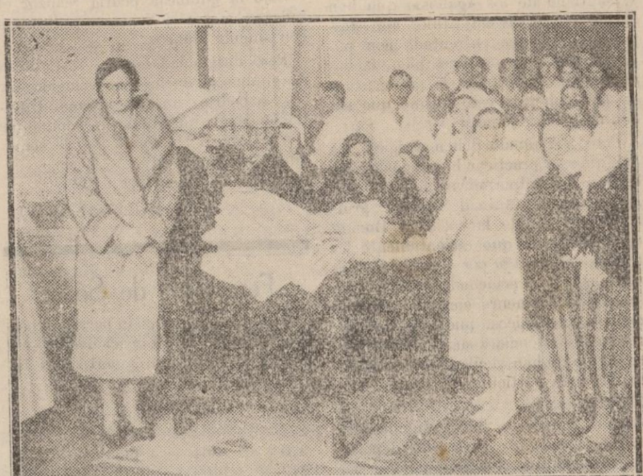
MADRID.—Reparto de ropa en la Casa de Salud de Sta. Cristina a los niños que nacieron durante el año 1932 en dicho establecimiento benéfico.