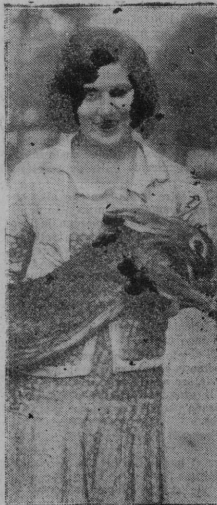
MADRID. — En la Exposición de aviación y aereocultura, en la Casa de Campo. — Un hermoso ejemplar de conejo gigante que ha obtenido premio.

Se detuvieron para echar la cuenta del dinero que se habrían gastado en tantos vasos de la óptica como habían bebido. Los veían a todos en fila, unos detrás de otros, en una formación imponente. ¡Un capital! ¡Un verdadero capital! ¡Eran unos derrochones! Y encima iban allí a prestarle un servicio al dueño con su vigilancia. ¡Servicio tontos! Con toda solemnidad juraron no volver más por allí, abandonando el café.