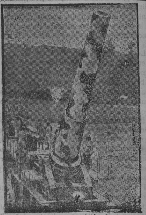
Cañón de 400 en posición de tiro.