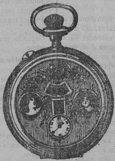
El maravilloso reloj automático