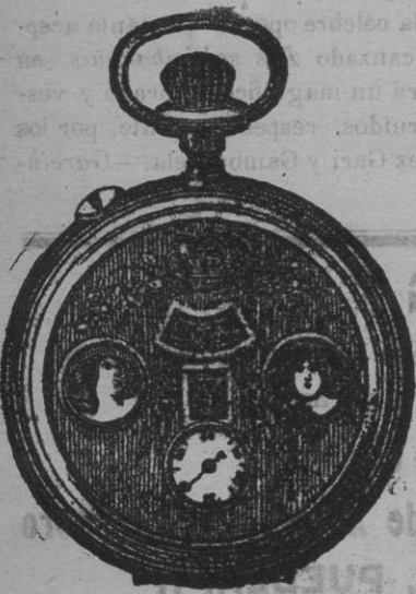
El maravilloso reloj automático