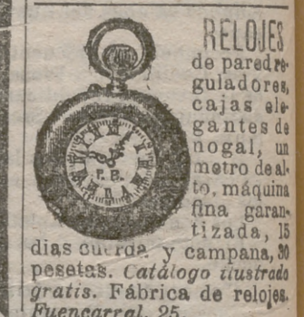
RELOJES de pared reguladores, cajas elegantes de nogal, un metro de alto, máquina fina garantizada, 15 días cuerda y campana, 20 pesetas. Catálogo ilustrado gratis. Fábrica de relojes. Puencarral, 25.

RETRATOS DEL DOCTOR Ezquerdo al lapit litográfico, de 70 por 90 centímetros, mayor que tamaño natural, una peseta. Se vende en esta Administración y en casa de Irujo, librería, calle del Arenal.