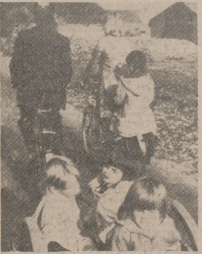
SPRANG CAPELIE (Holanda).—Como consecuencia del boicot impuesto por los países árabes productores de petróleo a Holanda, se ha limitado el consumo de carburante de los servicios públicos. Esta familia ha resuelto a su manera el problema a base de bicicletas y remolque.