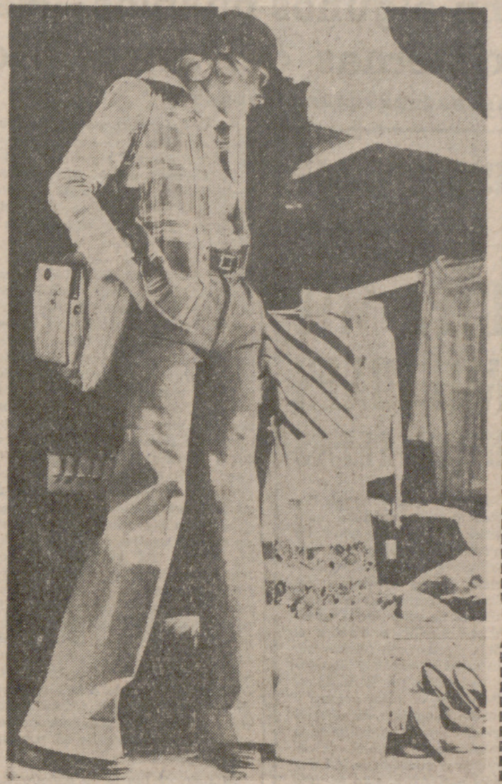
Conjunto sport formado por chaqueta en franela de puro algodón a cuadros rojo y beige, y pantalón tejano en sarga color azul, desteñido. Suéter cuello cisne de punto de algodón. Creaciónes Ackel y Male, de Frankfurt.

humedad. En resumen, las prendas de algodón son siempre amistosas con sus portadoras. A la mujer de hoy cada vez le agrada más evadirse de las prendas corrientes, y el otoño la ayuda en sus deseos. Así, los conjuntos de chaqueta o cazadora y pantalón de los fines de semana sirven también para practicar la caza, pasear por el bosque o para preparar el fuego de la comida campestre y sencilla, que a todos encanta. Para todas estas prendas, tanto la loneta como la pana en