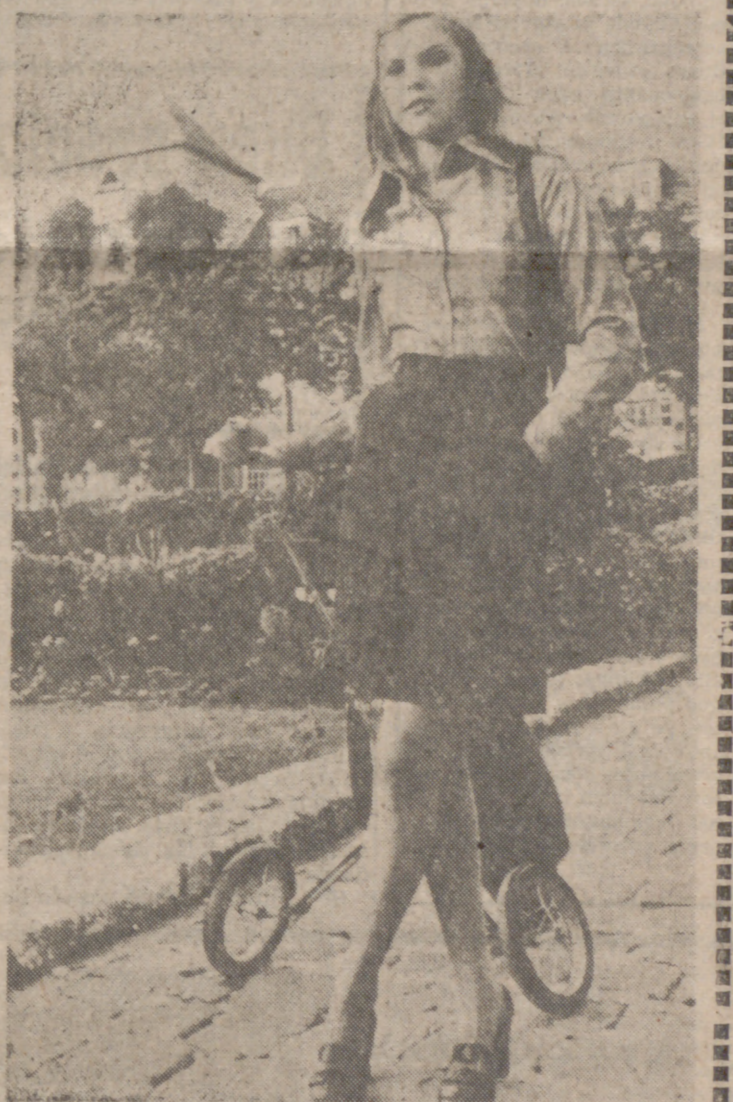
Blusa camisera en franela, a cuadros rosa y blanco, puro algodón. Se lleva sobre una falda en pana de algodón de fino bordón, rojo oscuro. Modelo Gaston Jauret.

Dieciséis centros emisores, repartidos por la Península y las Islas, recogen toda la información referida a las provincias. Corresponsales en Nueva York, París, Roma, Londres, Berlín, Beirut y en todas las capitales hispanoamericanas, así como enviados especiales, informan puntualmente de los acontecimientos de repercusión internacional y atienden la más rigurosa actualidad.