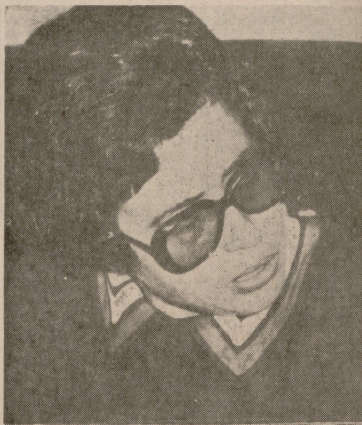
Doña Inés Ayllón Morito, la alcaldesa más joven de España, contaba veinticinco años cuando fue elegida para el cargo hace unos meses.