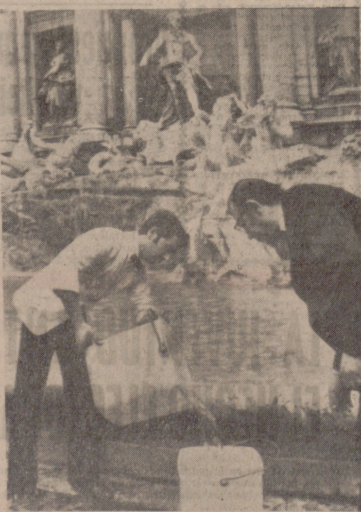
ROMA.—Un canarero recoge agua de la fuente de Trevi, durante el corte de suministro a la ciudad, con motivo de las reparaciones que se llevan a cabo en las conducciones de abastecimiento y que van a durar hasta el lunes.