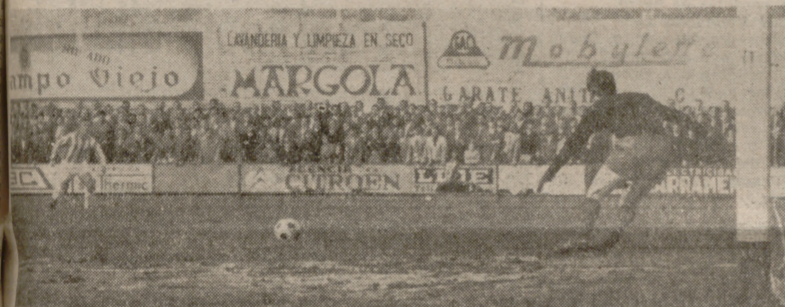
ALON SIN PELIGRO.—El lejano disparo de un delantero vallisoletano llega sin peligro hasta la puerta eibarresa. Murguiondo deja salir fuera la pelota, mientras Lizarralde, a lo lejos, con'empla el desenlace de la jugada.

que en principio se pensaba queda un tanto empalidecido al reproducirse una vez más ese mal endémico que padecen nuestros delanteros de cara al gol.