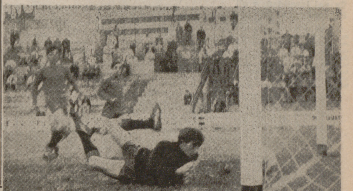
La fo'ografía recoge uno de los diez tantos logrados por el Europa. Fue una tarde plena de inspiración de nuestros artilleros.